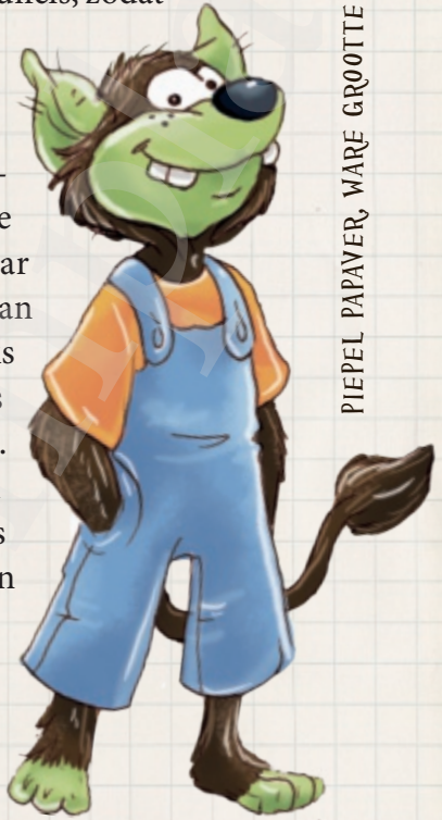
PIEPEL PAPAVER, WARE GROOTTE

Wij, Boeboeks, rekenen met keutels. Een keutel is ongeveer één centi­meter. Daarom noemen wij kleine Boeboeks keutels. Wij groeien elk jaar één keutel, tot ons elfde, twaalfde. Dan stoppen we met groeien. Boeboeks van zes, zoals Pit en Puf, zijn dus zes keutels of centimeter groot. Piepel en ik zijn al tien en dus zo'n vier centimeter groter dan ons jongere nichtje en neefje. Volwassen Boeboeks zijn ongeveer twaalf centi­meter groot. Er is één uitzondering: bonkel* Groezel. Die lieve, sterke beer is zowaar vijftien keutels groot! Oude Boeboeks krimpen weer een beetje, worden wat door­zichtig en stralen een witgeel schijnsel uit. Wij worden makkelijk honderdtachtig jaar oud, soms wel tweehonderd jaar en meer. Na onze dood keert een deel van ons terug naar de Aarde. Een ander deel wordt Water- of Luchtelf en een derde deel wordt weer herboren in een kleinkind of achterkleinkind.