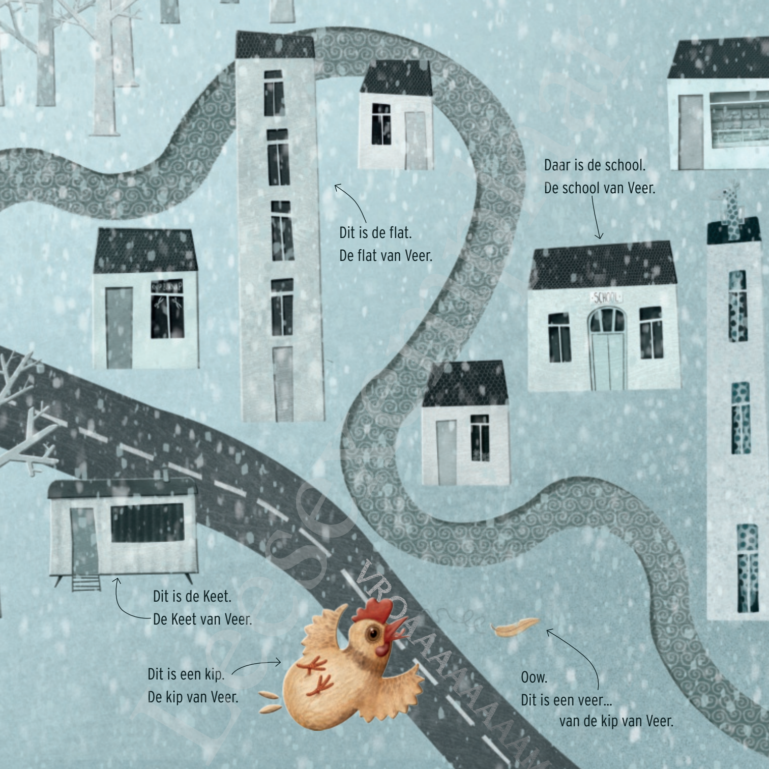
Dit is de flat. De flat van Veer.