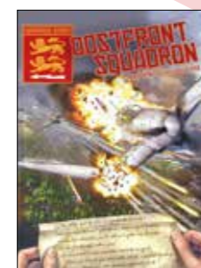
4. Vuurdoop in de Yak