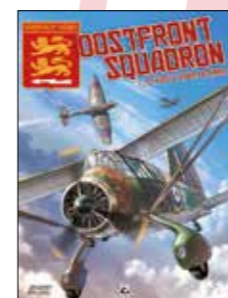
1. De route naar razernij