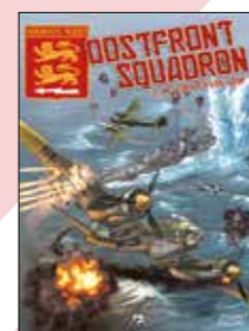
2. Het eskader van hoop