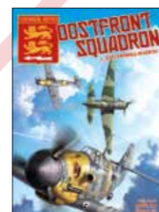
3. Bestemming Moskou