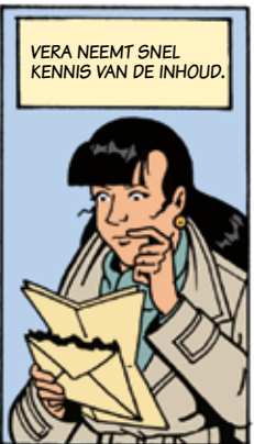
VERA NEEMT SNEL KENNIS VAN DE INHOUD.