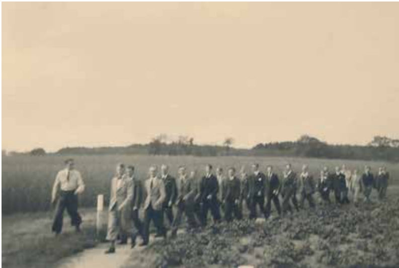
Christelijke jongemannenvereniging op pad.