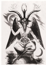
DE 'DUIVELSGEIT' IN DE GEDAANTE VAN BAPHOMET