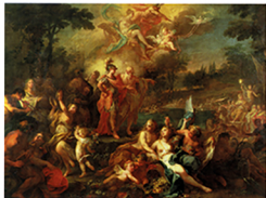
Boeien Het vissen van Aeneas in de Euxine Velden door Sebastiano Conca (1880-1784).

Zelfs na zijn dood bleef Anchises zijn zoon helpen. Zijn naam was Aeneas, hem op te zoeken in de onderwereld, waar hij de toekomst zou leren kennen. Anchises toonde hem de pelen die later moede zouden verwerpen in Aeneas' nieuwe rijk.