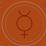
TEKEN & SYMBOOL