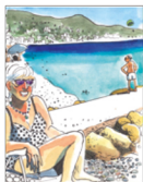
👁 Geef de lijntjes tussen de tanden niet aan.