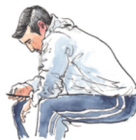
☞ Ook jonge mensen hebben een onderkin als ze voorover leunen.