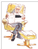
👁 Oudere mensen hebben een slappe hals.