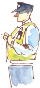
👁 Kijk uit naar puntige, rode neuzen.