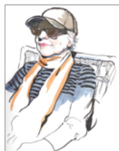
👁 Zoek naar het fijne lijnenspel van rimpels.