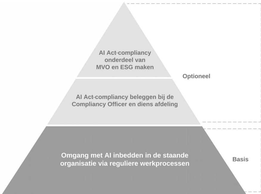
Afbeelding 1.3: Raamwerk voor inbedden AI Act met basis en opties.

Ten slotte geeft hoofdstuk 5 het raamwerk voor het inbedden van de AI Act en om compliant te blijven. Dit raamwerk laat meer ruimte en is bedoeld als basis om op verder te bouwen: