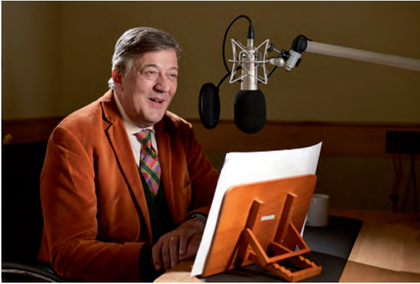
Een onberispelijke Stephen Fry leest Sherlock Holmes.