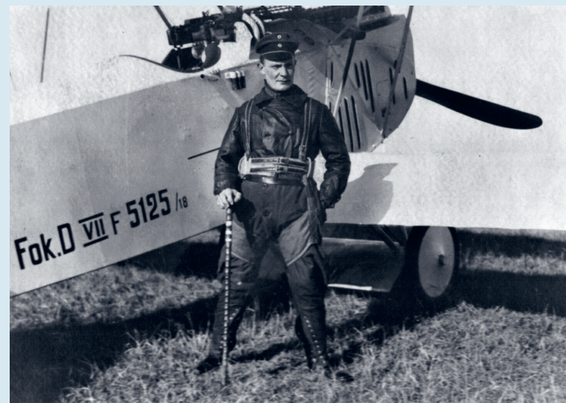
Jachtvlieger Göring tijdens de Eerste Wereldoorlog (1918). Hij staat hier met de zogenoemde Geschwaderstock voor zijn Fokker D.VII F5125/18-machine. Op zijn rug draagt hij een parachute.

Als rijksjacht- en rijksbosbouwmeester is Göring heer en meester over alle Duitse jacht- en natuurgebieden. Op dit gebied verricht Göring goed werk en veel van zijn jachtwetten gelden ook nu nog in Duitsland. Jagers worden wereldwijd ook wel de 'groene mafia' genoemd, omdat ze met elkaar een passie, de jacht, delen. Het is een ongeschreven code dat ze elkaar altijd bijstaan. En