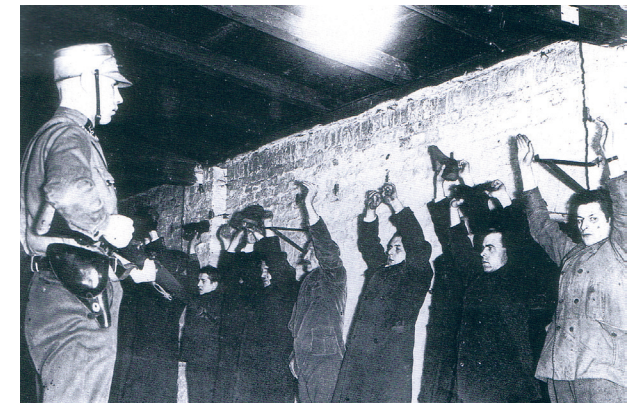
Op 27 februari 1933 steken de nazi's het gebouw van de Reichstag in brand, waarna er in heel Duitsland zowel door de SA als door de reguliere politie onder leiding van Göring op grote schaal politieke tegenstanders worden gearresteerd.

Ook onder buitenlandse journalisten en diplomaten scoort Göring hoog als een van de weinige redelijke nazi's die rustig kunnen luisteren en met wie je argumenten kunt uitwisselen. Zo roemt de Duitse chef-tolk Paul Schmidt Görings aanleg en kwaliteiten als diplomaat die bij complexe vraagstukken buitengewoon snel de hoofdlijnen eruit haalt om deze vervolgens uit te onderhandelen. Göring fungeert met name in de jaren dertig als een soort schaduwminister van Buitenlandse Zaken, waarbij hij vooral met de landen van Zuidoost-Europa en Italië intensieve contacten onderhoudt.