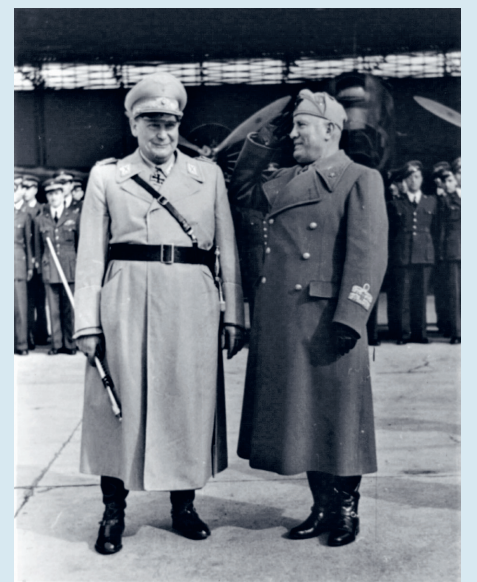
Göring beschouwt zichzelf als een soort schaduwminister van Buitenlandse Zaken met Zuidoost-Europa en Italië in zijn portefeuille. Hier samen met Mussolini, met wie hij goed kan opschieten.

Als op 8 februari 1942 Fritz Todt, de minister voor bewapening en munitie, bij het opstijgen vanaf het vliegveld bij de Wolfsschanze om het leven komt, benoemt Hitler tot ieders verrassing zijn architect Albert Speer, die dan toevallig in de Wolfsschanze is, tot opvolger van Todt. Speer wordt