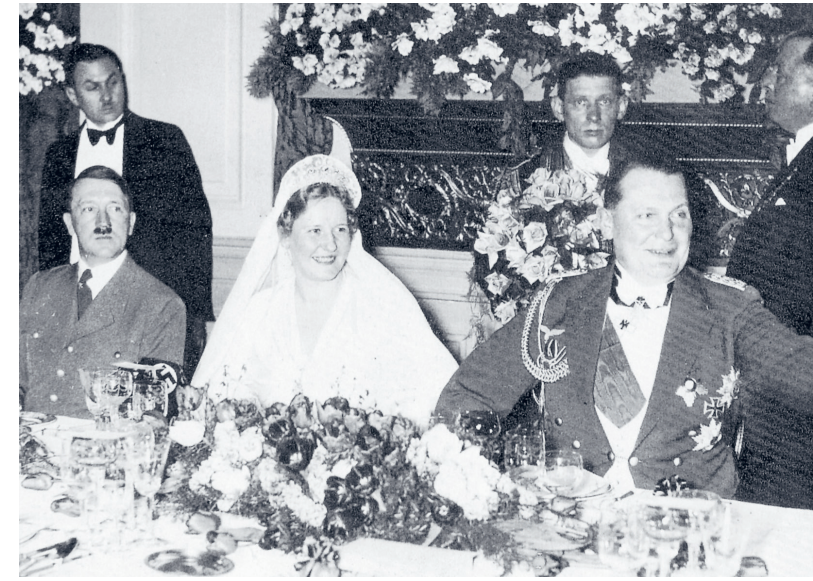
Na het overlijden van zijn eerste vrouw Carin in 1931 ontmoet Göring een nieuwe liefde. Het is de toneelster Emmy Sonnemann, met wie hij in 1935 in het huwelijk treedt, waarbij Hitler getuige is.

rier. Tijdens een van zijn reizen ontmoet hij in Zweden de getrouwde barones Carin von Kantzow geboren Von Fock, die halsoverkop verliefd wordt op de Duitse oorlogsheld en man en kind voor Göring verlaat om in 1923 met hem in München te trouwen.