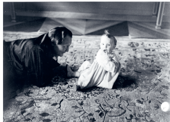
De rijksmaarschalk aan het spelen met zijn dochtertje Edda.

Niet alleen bij buitenlandse staatshoofden, ministers en diplomaten is Göring geliefd, maar ook bij de Duitse bevolking. Hij krijgt de liefkozende bijnaam 'de dikke' en wordt door zijn tomeloze energie en daadkracht ook wel 'der