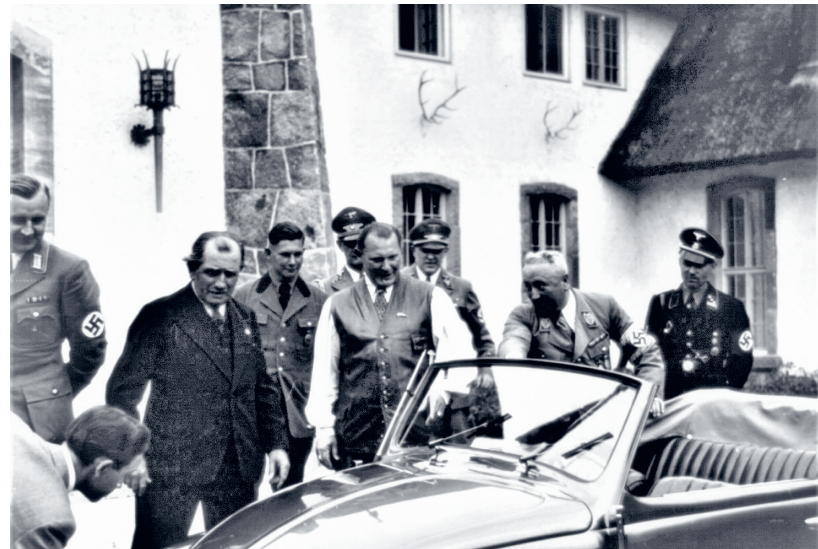
Het Deutsche Arbeitsfront schenkt in 1938 een VW-cabriolet aan Göring, na Hitler de machtigste man in Duitsland en naast tal van andere functies ook dictator van de oorlogseconomie.

ook hier weet Göring zijn Carinhall slim in te zetten, door uit de hele wereld jagers met politieke invloed uit te nodigen voor de jacht. Zo heeft hij tijdens de vele jachtpartijen tal van open en intensieve gesprekken met buitenlandse staatshoofden, ministers en diplomaten over politieke, economische en militaire kwesties.