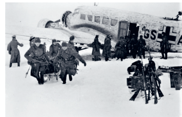
Nadat het Zesde Legerkorps in november 1942 bij Stalingrad door de Russen is omsingeld, denkt Göring – in tegenstelling tot zijn experts – de circa 300.000 soldaten vanuit de lucht te kunnen bevoorraden en verzekert de Führer dat hij daarvoor persoonlijk garant staat. Hitler gelooft hem, met alle gevolgen van dien.