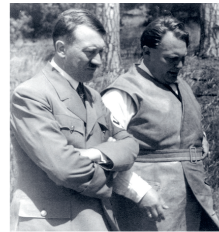
In de jaren dertig is Göring de belangrijkste man na Hitler en diens officiële opvolger. In crisissituaties blijft hij in tegenstelling tot Hitler zijn emoties de baas.

In 1927 kan hij als gevolg van een algemene amnestie terugkeren naar Duitsland, waar hij zich weer aansluit bij Hitler en zijn NSDAP. Met het oog op zijn faam als oorlogsheld, zijn goede komaf en zijn vele contacten met Duitse industriële zet Hitler hem op een verkiesbare plaats voor de Reichstag. In 1932 worden de nazi's de grootste politieke partij van Duitsland en wordt Göring president van de Reichstag. Na veel gekonkel en beraad achter de schermen, weet hij de oude rijkspresident Paul von Hindenburg zover te krijgen om Hitler op 30 januari 1933 tot rijkskanselier te benoemen. En daarmee begint de komeetachtige opmars van Göring in het Derde Rijk.