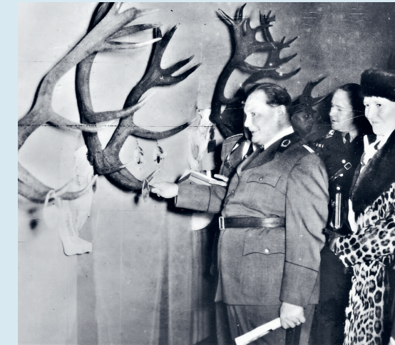
In zijn hoedanigheid als Reichsjägermeister bezoekt Göring samen met Emmy de grote internationale jachttentoonstelling in Berlijn (1937).

Göring is faliekant tegen de plannen van Hitler om Tsjechië en Polen en op langere termijn Rusland aan te vallen. Maar echt direct tegenspreken, durft hij zijn Führer niet. Hij weet uit ervaring dat hoe meer je Hitler tegensprekt, hoe hardnekkiger die aan zijn plannen vasthoudt. Wel weet Göring een oorlog om Tsjechië te vermijden door – min of meer tegen Hitlers wil – de Conferentie van München (september 1938) te organiseren, waarbij de Europese grootmachten ermee instemmen dat Tsjechië het Sudetenland afstaat aan Duitsland.