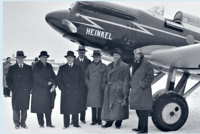
Als opperbevelhebber van de Luftwaffe is Göring verantwoordelijk voor de opbouw en verdere uitbouw van dit wapenonderdeel. Göring: 'Mij staat een Luftwaffe voor ogen, die als de strijd eenmaal uitbreekt zich als een machtig koor van wrekers op de vijand stort, waardoor deze het gevoel moet krijgen dat de strijd al verloren is nog voordat deze is begonnen.'

Als op 22 november 1942 het Zesde Leger onder generaal-veldmaarschalk Friedrich Paulus met 300.000 soldaten bij Stalingrad door het Rode Leger volledig is ingesloten, scheidt een stralende Göring, zonder ook maar één kritische vraag te stellen over de situatie, richting Hitler op dat hij er persoonlijk garant voor staat dat zijn Luftwaffe het ingesloten legerkorps vanuit de lucht zal verzorgen. En daarmee geeft hij Hitler een argument richting Paulus om zich niet terug te trekken, met alle gevolgen van dien. Bij de Slag om Stalingrad zijn circa 170.000 Duitse soldaten en meer dan 500.000 Russische soldaten gesneuveld. In totaal worden ca. 90.000 Duitse soldaten in gevangenschap afgevoerd, van wie maar 6.000 Duitsland ooit zullen weerzien. Op papier is