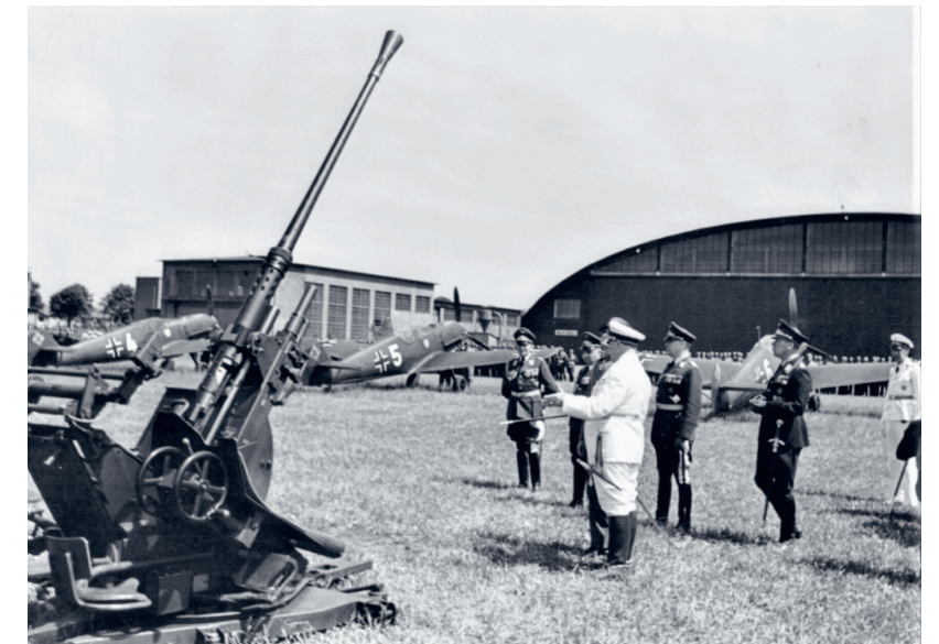
Op bezoek bij de Flak-school op het militaire vliegveld Gatow bij Berlijn (juni 1939). Göring vertrouwt erop dat het Flak-geschut vijandelijke vliegtuigen uit het Duitse luchtruim kan weren. Een fatale inschatting, zoals later zal blijken.

Tot 1944 bepaalt Hitler – en Göring volgt hem tegen beter weten in – dat de Luftwaffe vooral duikbommenwerpers moet produceren en geen jagers om vijandelijke vliegtuigen uit het Duitse luchtruim te verjagen. Dat is volgens Hitler de taak van het Flak-geschut. Volgens Milch is dat een fatale inschattingsfout. Als pas in 1944 het roer drastisch wordt omgegooid, zoals Milch al twee jaar eerder hartstochtelijk heeft bepleit, en er grote aantallen jagers van de band rollen, is het te laat. Door de grootschalige en frequente bombardementen op de Duitse vliegtuig- en kogellagerindustrieën en