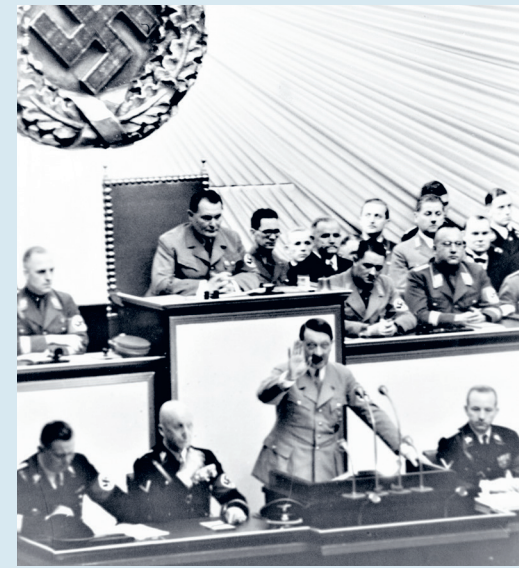
Als president van de Rijksdag torent Göring boven Hitler uit, die hier een van zijn vele toespraken houdt.

Vanaf zijn benoeming zal Speer zijn macht stap voor stap ten koste van Göring weten uit te breiden. Daarbij volgt hij een simpele, maar beproefde tactiek: aan de ene kant door formeel en op papier van functies af te zien en anderzijds door met vleierij in te spelen op de eigendunk en verwaandheid van Göring.