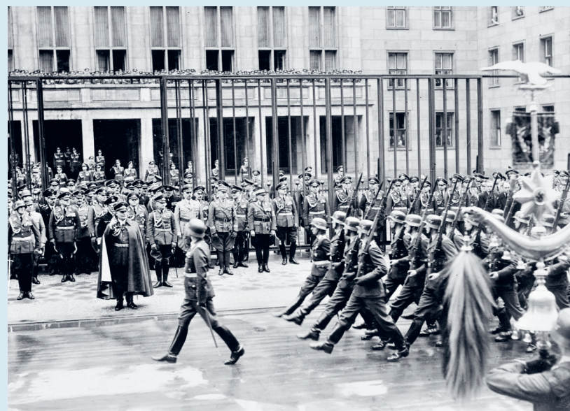
Een van de vele parades voor het nieuwe Reichsluftwaffe-ministerie. Het complex is in de jaren 1935-1936 gebouwd en was toen na het Pentagon het grootste kantoorcomplex ter wereld met ruim drieduizend vertrekken en een totale vloerooppervlakte van tienduizend vierkante meter.

Maar ook Milch kan het tij niet meer keren. In essentie is de oorzaak van de falende Luftwaffe het feit dat Hitler de oorlog begint terwijl zijn Luftwaffe nog minstens twee jaar nodig heeft om met succes inzetbaar te kunnen zijn.