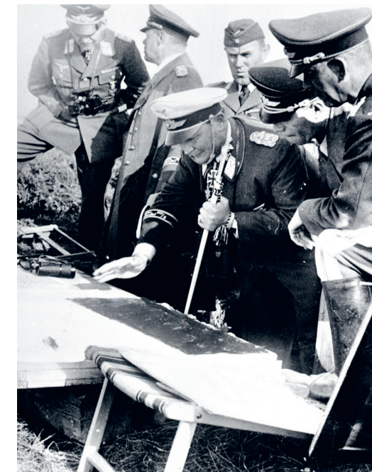
Op bezoek bij een van de steunpunten van de Luftwaffe aan de Kanaalkust bespreekt Göring specifieke aanvalsplannen tegen Engeland (1940).

Na de dood van generaal Udet wordt Milch vanaf eind 1941 weer de eindverantwoordelijke voor de bewapening. Hij voert met succes massaproductie van bepaalde typen vliegtuigen in door standaardisatie in te voeren, overbodig handwerk af te schaffen en productiemethoden te verbeteren. Hoewel de Luftwaffe aanvankelijk in Rusland grote successen weet te behalen en tot 1942 het Russische luchtruim beheerst, lukt het niet om de Russische luchtmacht echt te verslaan. Hoofdoorzaken zijn onder meer een nijpend tekort aan vliegtuigen, ervaren piloten, en brandstof en het lage onderhoudsniveau.