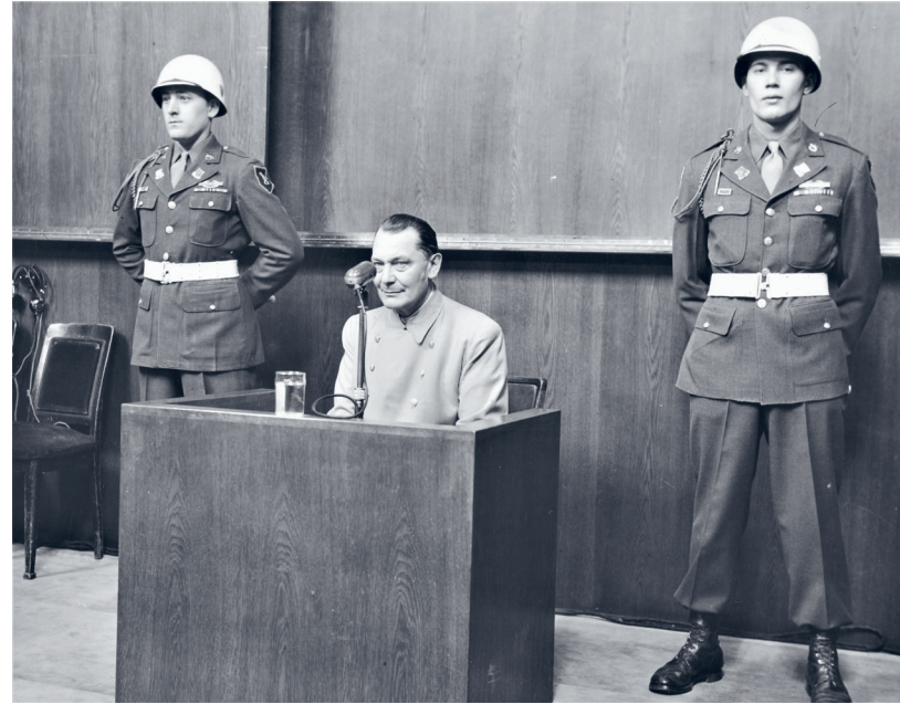
Tijdens het proces in Neurenberg werpt een vitale, afgeslankte en afgekickte Göring zich op als 'nazi nummer 1' en is hij aanvankelijk rechters en aanklagers te slim af.

Göring sterft om precies 22.44 uur. Een dag later worden de lichamen van de geëxecuteerden gecremeerd en