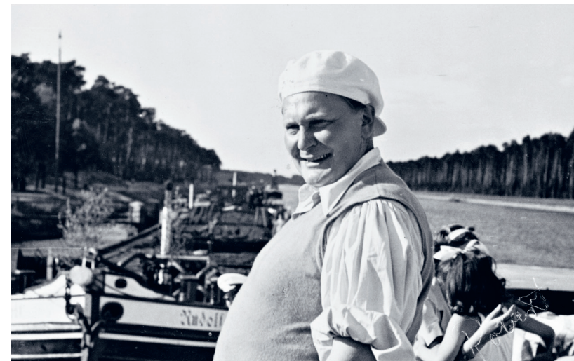
Göring op zijn jacht Carin II, dat een huwelijksgeschenk is van het Reichsverband der Automobilindustrie en vernoemd is naar zijn eerste vrouw Carin.

Als gevulmachtigde voor het Vierjarenplan is Göring zonder enige twijfel de economisch dictator van de Duitse economie en daarbij centrale aanjager van de transformatie van deze economie in een Blitzkrieg-economie, met een zwaar accent op de bewapening en het voorbereiden van aanvalsoorlogen. Görings motto bij de herbewapening is: liever kanonnen dan boter. Vliegtuigen, tanks, oorlogsschepen en dergelijke zijn belangrijker dan de particuliere