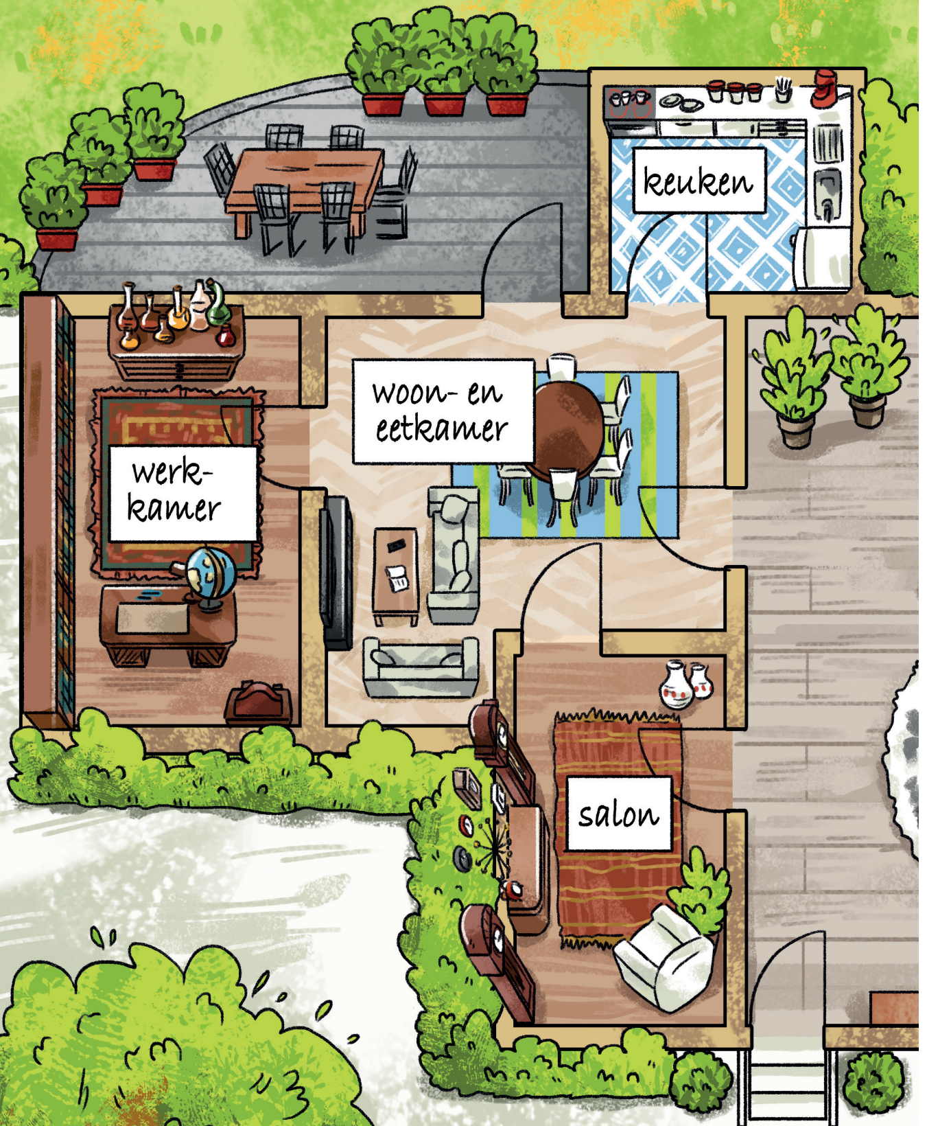
Villa Erik Vogel