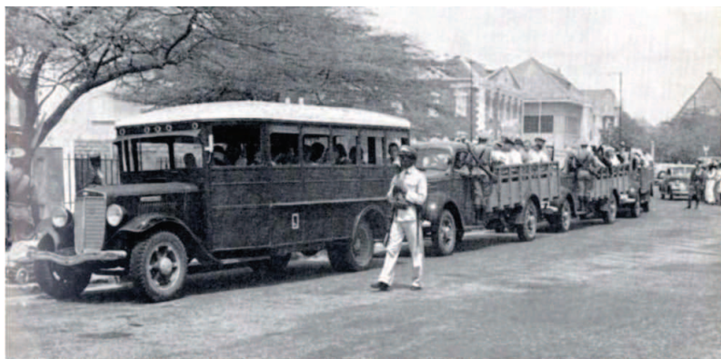
Razia op Curaçao, 10 mei 1940; de meeste gearresteerden brachten de volgende vijf jaar door in het interneringskamp op Bonaire.