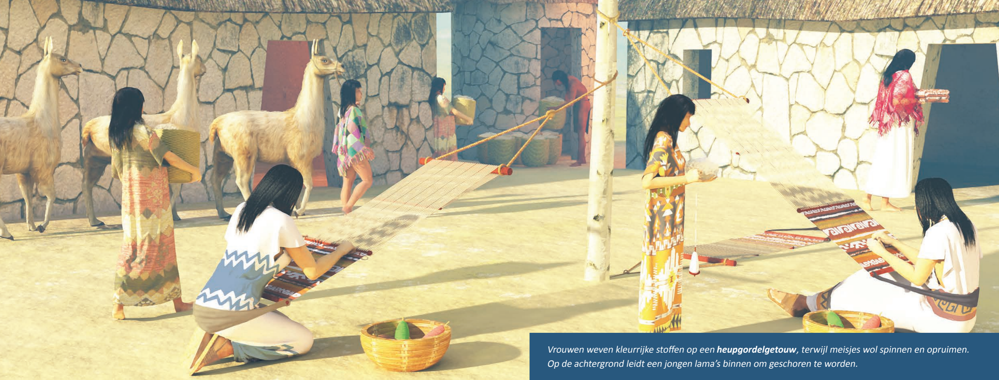
Vrouwen weven kleurrijke stoffen op een heupgordelgetouw , terwijl meisjes wol spinnen en opruimen. Op de achtergrond leidt een jongen lama's binnen om geschoren te worden.