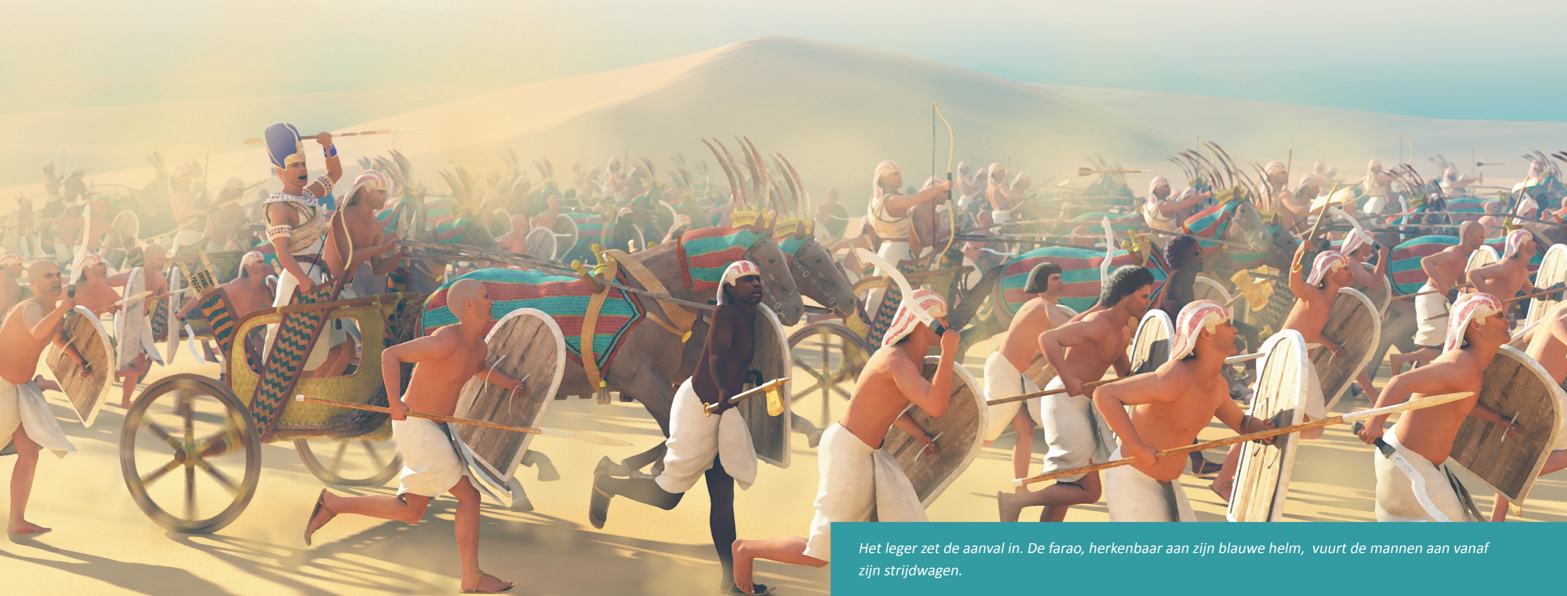
Het leger zet de aanval in. De farao, herkenbaar aan zijn blauwe helm, vuurt de mannen aan vanaf zijn strijdwagen.