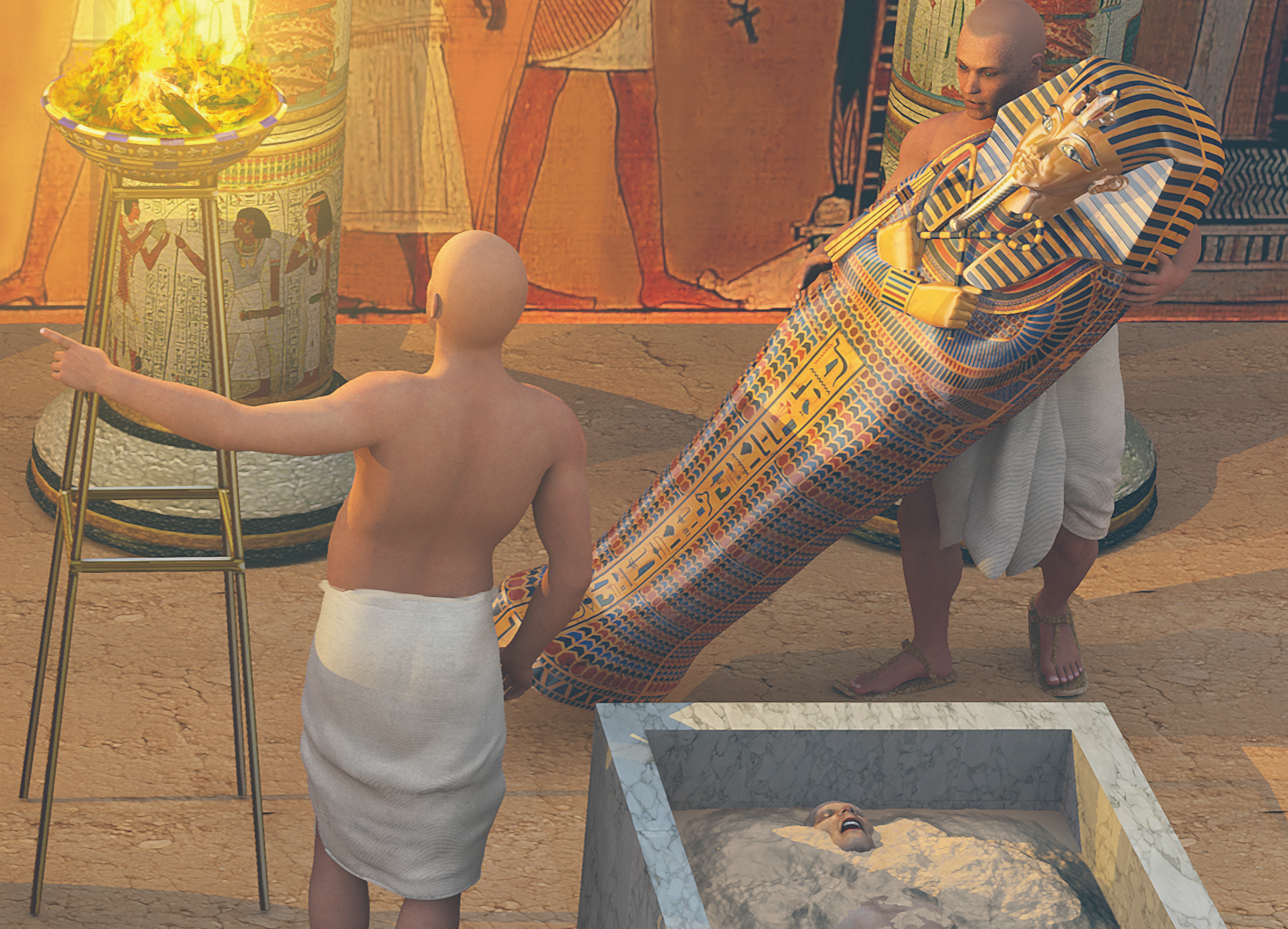
Een priester wikkelt een uitgedroogd lichaam in linnen doeken. Een ander lichaam ligt in natron. De beschilderde sarcofaag is klaar voor een mummie.