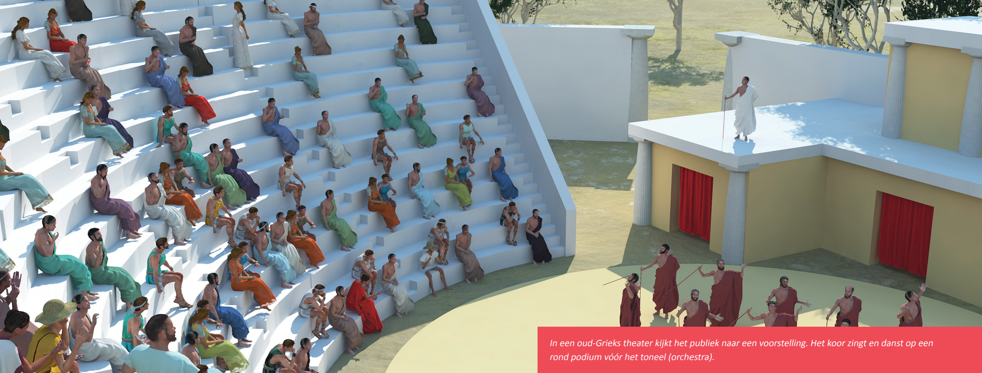
In een oud-Grieks theater kijkt het publiek naar een voorstelling. Het koor zingt en danst op een rond podium vóór het toneel (orchestra).