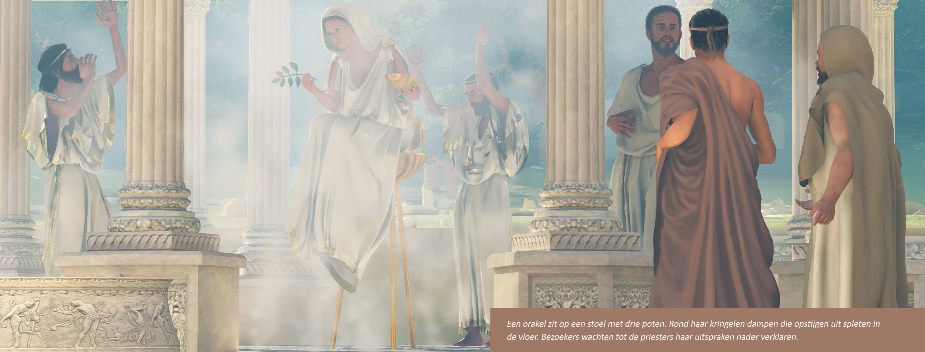
Een orakel zit op een stoel met drie poten. Rond haar kringelen dampen die opstijgen uit spleten in de vloer. Bezoekers wachtten tot de priesters haar uitspraken nader verklaren.