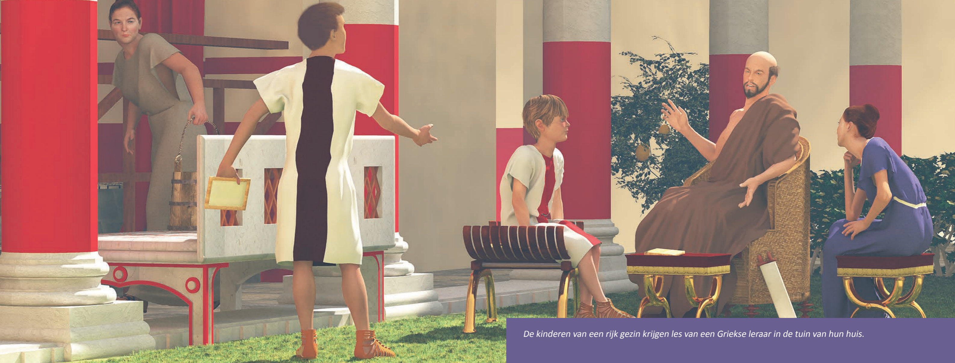
De kinderen van een rijk gezin krijgen les van een Griekse leraar in de tuin van hun huis.