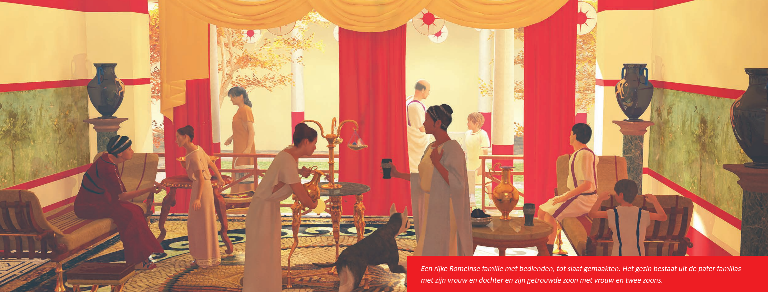
Een rijke Romeinse familie met bedienden, tot slaaf gemaakten. Het gezin bestaat uit de pater familias met zijn vrouw en dochter en zijn getrouwde zoon met vrouw en twee zoons.