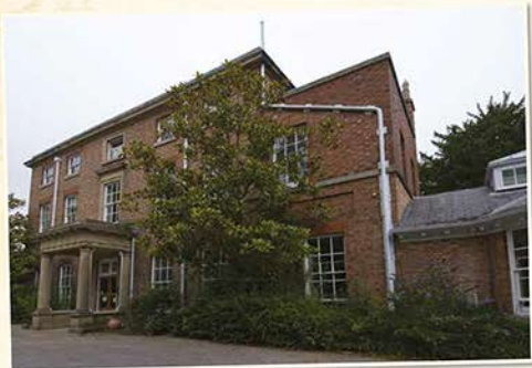
In dit huis groeide Charles op. Zijn ouders hadden het in 1800 laten bouwen.

Charles werd geboren in 1809. Zijn ouders waren rijk. Zijn vader Robert Darwin was succesvol als arts en zijn moeder Sukey Wedgwood erfde een fortuin vanwege de aardewerkfabriek van haar familie. In hun enorme huis in Shrewsbury hadden ze genoeg plek voor hun zes kinderen en de bedienden die voor de huishouding zorgden.