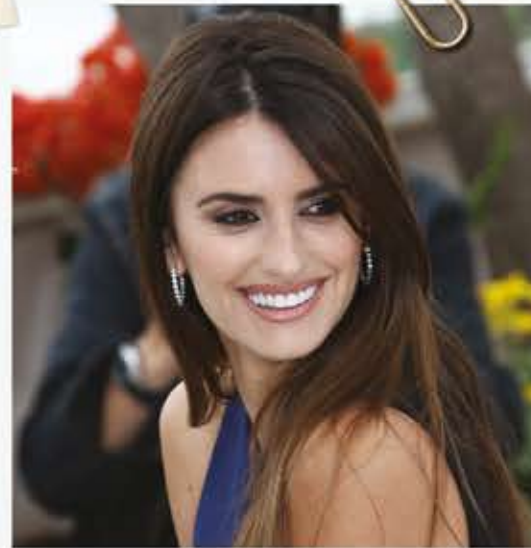
Penélope Cruz heeft haar eigen ster op de Walk of Fame in Hollywood.

Een model draagt een jurk van ontwerpster Estrella Arch's bij een show in Parijs.