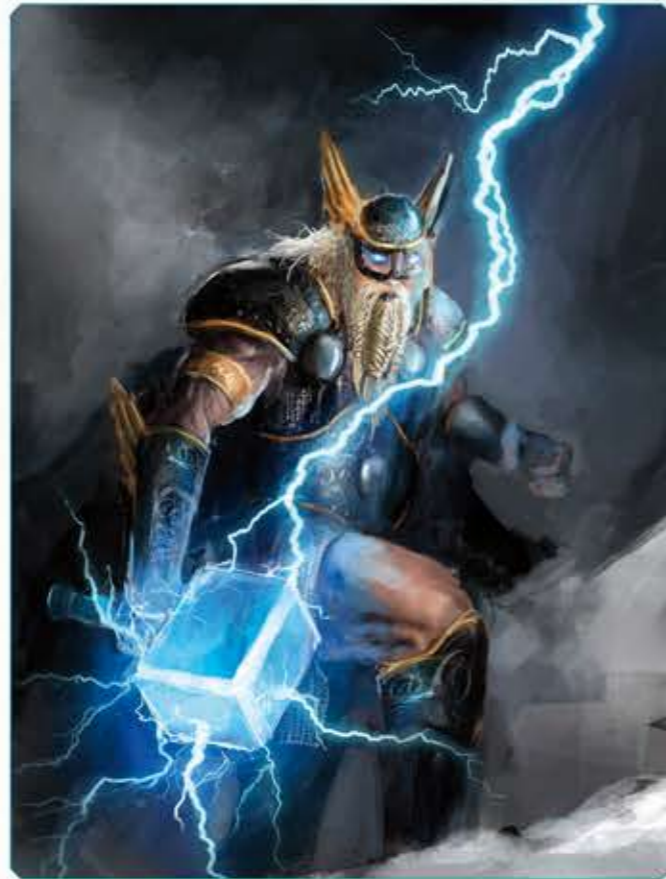
Thor vecht met zijn krijgshamer, die hij Mjöllnir noemt, graag tegen reuzen.

Thor, de zoon van Odin en Frigg, was de god van de donder en bliksem. Thor was een sterke god en stond erom bekend dat hij reuzen kon doden. Thor wordt altijd afgebeeld met zijn krijgshamer. Als Thor zijn hamer gooide, raakte hij altijd zijn doel en de hamer kwam als een boemerang bij hem terug.