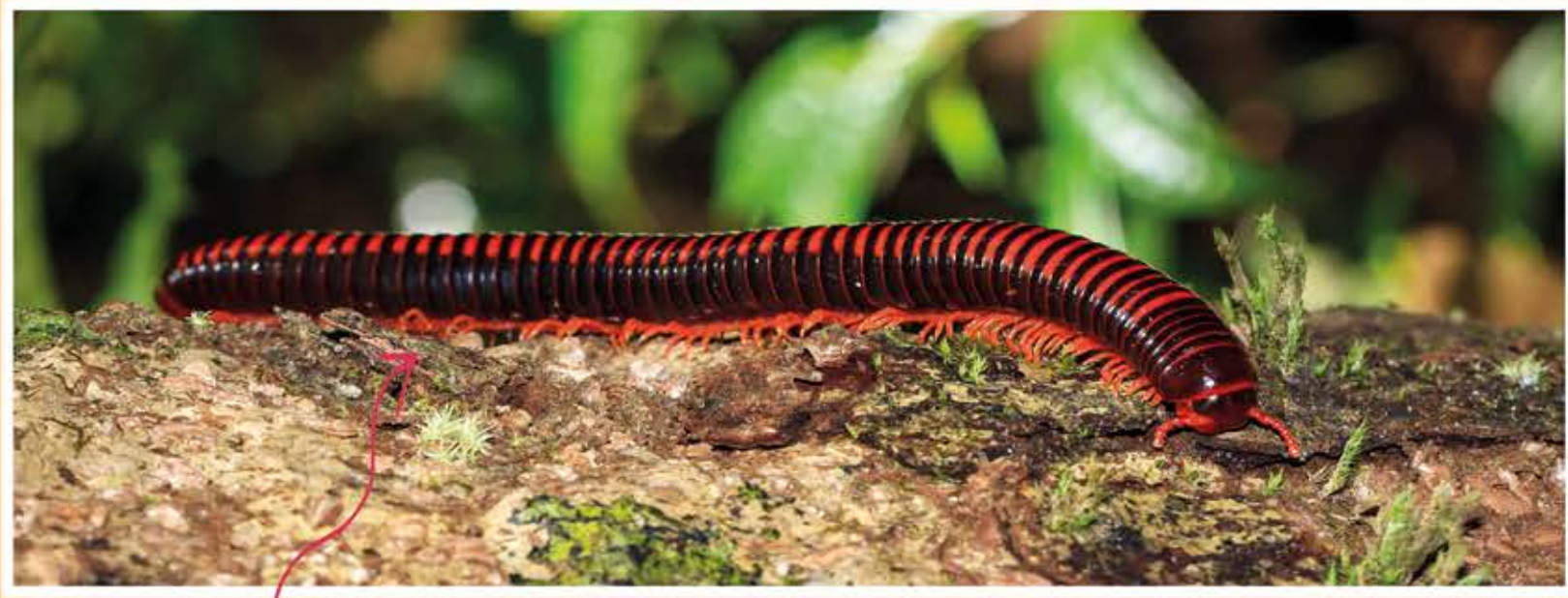
Een miljoenpoot van Madagaskar

Duizendpoten hebben een heleboel poten. Het zijn er niet precies duizend, maar wel héél veel! Duizendpoten komen al heel lang op aarde voor. Ze bestaan zelfs al veel langer dan de dinosauriërs.