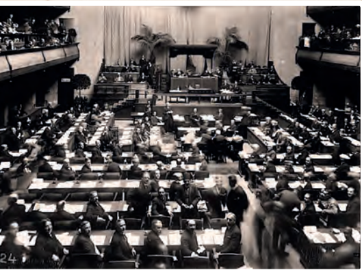
Bijeenkomst van de Volkenbond in 1920, in Genève, Zwitserland.

President Woodrow Wilson van de Verenigde Staten had één droom: het oprichten van een platform dat internationale conflicten kon oplossen. Hij werd geïnspireerd door de afschuw die tijdens WO I bij iedereen was ontstaan. De eerste vergadering van de Volkenbond vond plaats op 16 januari 1920. Al eerder, op 25 januari 1919, gingen 44 landen akkoord met de oprichting. Het hoofdkwartier van de Volkenbond werd Genève, Zwitserland.