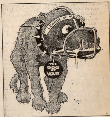
Zie je deze cartoon uit 1919? De Volkenbond is daar de muilkorf van de 'oorlogshond'. Zo vurig hoopte men dat de bond de wereldvrede zou handhaven.

In de jaren 30 werden de zwakke punten van de bond steeds duidelijker. Zo bleek het onmogelijk om effectief op te treden tegen agressieve landen, zoals Japan (zie bladzijden 36-37). En ook al was algehele ontwapening een heel populair idee na WO I, het was bijna niet waar te maken.