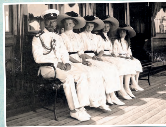
Tsaar Nicolaas II met zijn dochters op het familiejacht. In 1918 werden zij allemaal vermoord door de bolsjewieken.

vonden de meeste Russen dat hun tsaar Nicolaas en zijn familie onbekwaam en corrupt waren.