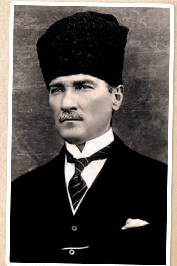
Rechts: Kemal Atatürk. Hij stichtte in 1923 de Turkse Republiek en werd de eerste president.