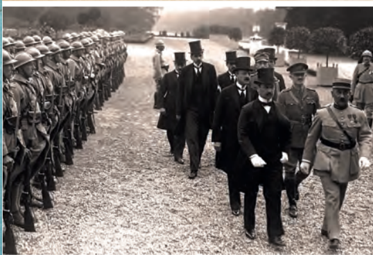
Links: De afgevaardigden voor ondertekening van het Verdrag van Trianon arriveerden.

Het Verdrag van Sèvres uit augustus 1920 was een verdrag tussen de Geallieerden en het Ottomaanse Rijk. Het Ottomaanse Rijk raakte daarbij zijn Arabische gebieden kwijt en West-Turkije werd aan Griekenland gegeven. Maar de nieuwe republikeinse regering van Turkije accepteerde dit verdrag niet. Daarom werd het in juni 1923 vervangen door het Verdrag van Lausanne. Het Griekse gebied werd weer teruggegeven aan Turkije en de nieuwe grenzen van Turkije werden nu erkend.