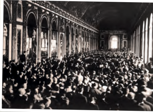
De internationale afgevaardigden verzamelden zich in de Spiegelzaal van het Paleis van Versailles om het verdrag te ondertekenen.

van de eerste naoorlogse Duitse regering, Philipp Scheidemann, trad daarom af. Zijn opvolger, Gustav Bauer, probeerde het verdrag nog aan te passen. Uiteindelijk stelden de Geallieerden een ultimatum – als Duitsland weigerde te tekenen zouden de Geallieerden binnen 24 uur het land binnenvallen. Bauer wilde dat niet. Daarom stuurde hij een telegram aan de Franse leider Georges Clemenceau om te zeggen dat Duitsland het verdrag zou ondertekenen.