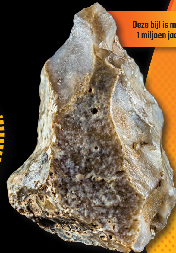
Deze bijl is meer dan 1 miljoen jaar oud.

In 1876 vond de Schot Alexander Graham Bell de telefoon uit.