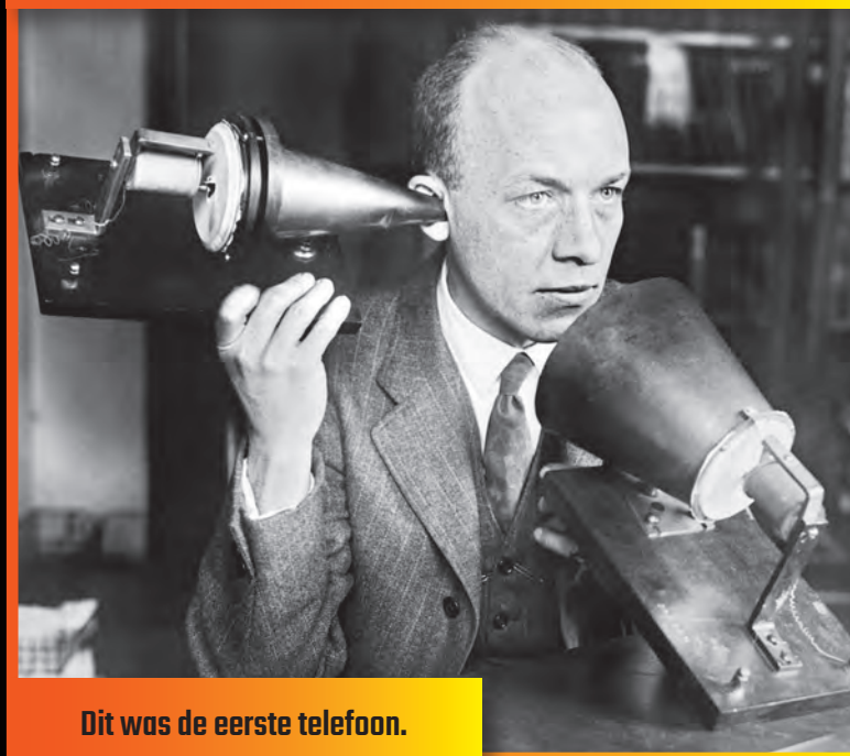
Dit was de eerste telefoon.

In 1876 vond de Schot Alexander Graham Bell de telefoon uit.