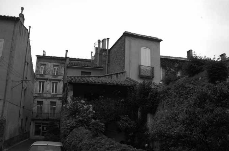
Het geboortehuis van Thomas Merton op de hoek van de Rue du 4 septembre in Prades

dat hij zo dicht bij zo'n abdij was geboren ertoe heeft bijgedragen dat hij later monnik is geworden.