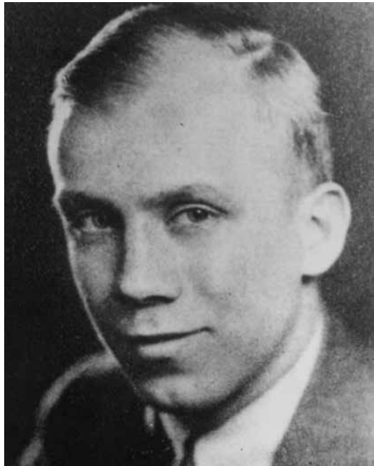
Foto van Merton in het Columbia Yearbook van 1939.

In sommige opzichten was Mertons leven aan de Columbia Universiteit niet echt anders dan in Cambridge. Op feestjes speelde hij vol enthousiasme piano, zong ruige liedjes en dronk zoveel dat hij geregeld een kater had.