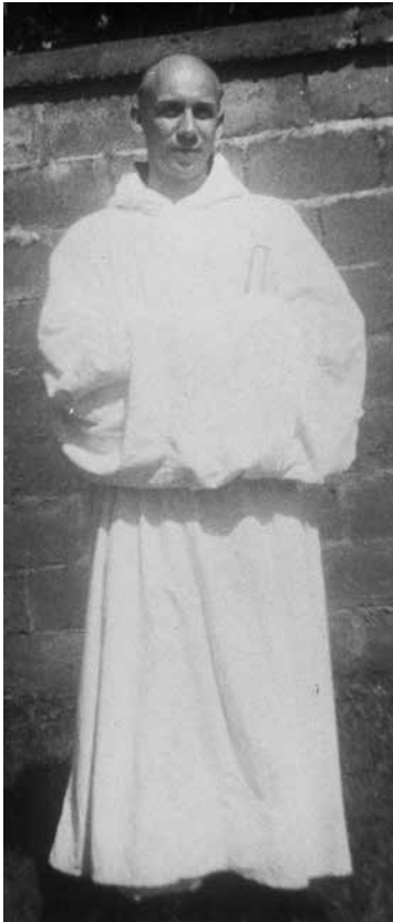
Thomas Merton in de begintijd van zijn kloosterleven