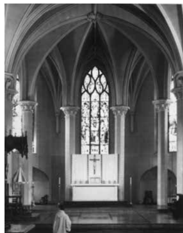
Abdijkerk van Gethsemani

Gecommuniceerd werd er vooral via gebarentaal, waarvoor vierhonderd handgebaren werden gebruikt die vooral betrekking hadden op gebed, werk en eten. Tenzij met bijzondere toestemming, mocht slechts vier keer per jaar post gestuurd worden naar de buitenwereld, op Pasen, Hemelvaart, Allerheiligen en