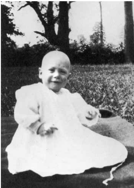
Thomas Merton als peuter in Prades in de Franse Pyreneeën.

Thomas Merton werd 's avonds laat geboren tijdens een sneeuwstorm op de laatste dag van januari 1915 in Prades, een oud stadje in de Franse Pyreneeën niet ver van de Spaanse grens. Een paar maanden eerder was net de Eerste Wereldoorlog uitgebroken. In zijn autobiografie schreef Merton: "Slechts enkele honderden kilometers van mijn geboortehuis, werden bij de Marne, in een bos met bomen zonder takken, de mannen opgevist, die in de natte loopgraven lagen te rotten tussen de paardenkadavers en het vernielde geschut". 1