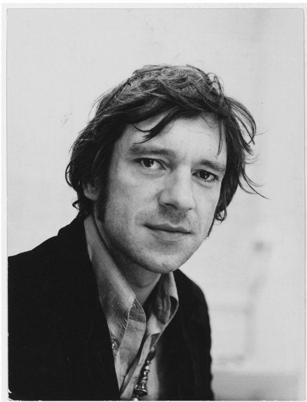
Ramses Shaffy

Je kop in de hoogte, je neus in de wind en lap aan je laars hoe een ander het vindt. Hou een hart vol van warmte en van liefde in je borst, maar wees op je vierkante meter een vorst! Wat je zoekt, kan geen ander je geven. Mens, durf te leven!