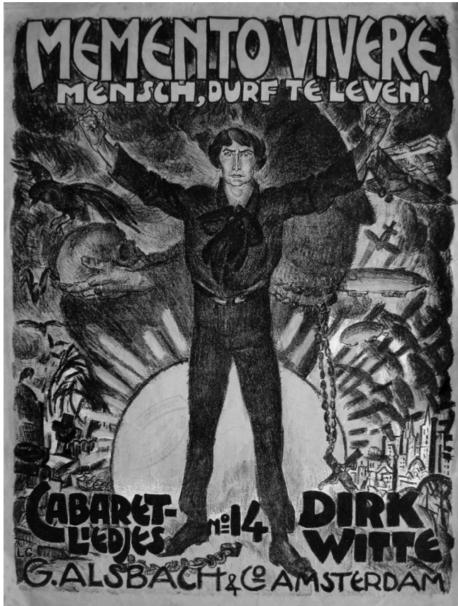
Illustratie: Leo Gestel