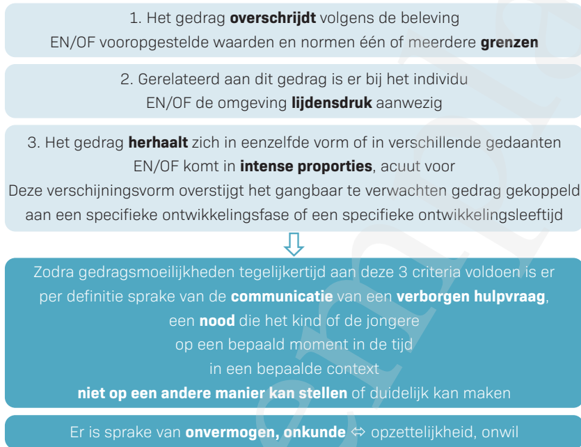
Figuur 1.1. Definiëring van moeilijk gedrag.

In dit boek zal gedrag bij kinderen en jongeren dat op een bepaald moment in de tijd in een bepaalde context tegelijkertijd aan drie criteria voldoet, van nabij bekeken worden. De termen 'moeilijk gedrag' en 'gedragsmoeilijkheden' worden verder als synoniemen gebruikt.