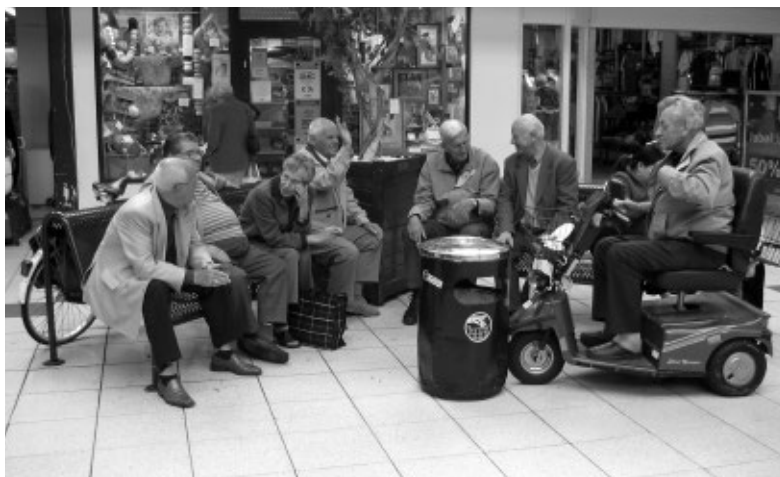
hangouderen in Groningen

Om al die woorden te bewaren, is er dit boekje, maar er is sinds kort ook een speciaal woordenboek gewijd aan nieuwe woorden. In 2018 is er op het Instituut voor de Nederlandse Taal (INT) gestart