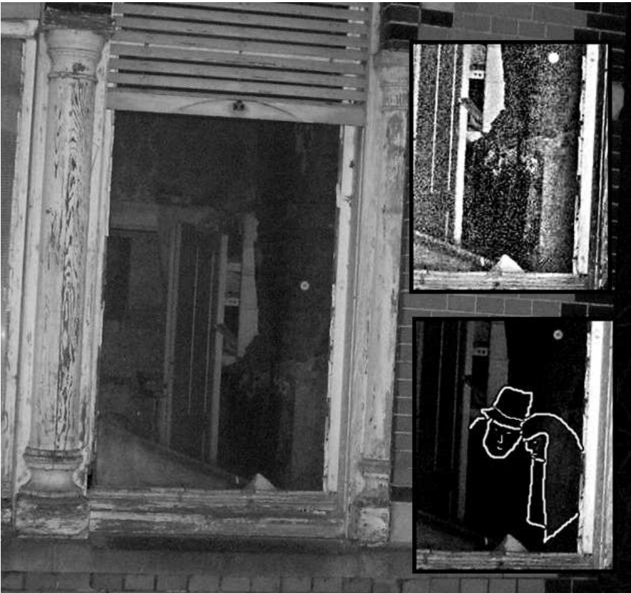
Foto gemaakt door Monique Hendriks in maart 2007 bij de Jufferschans in IJzendijke. Rechts ziet u respectievelijk een scherper gemaakte afbeelding en een weergave van de contouren.

Het is bijzonder om te zien hoe een stuk geschiedenis zich op spookfoto's aftekent. De onderstaande foto maakte ik een maand later in april 2007, tijdens een onderzoek op dezelfde locatie. Op de vergroting is te zien dat er een witte dame en een man naast elkaar staan, die beiden in dezelfde richting kijken. Ik ben ervan overtuigd dat er in dit huis een baby is gestorven onder zeer akelige omstandigheden. Dusdanig heftig dat zielen uit het verleden de woning niet los kunnen laten omdat mogelijk het echte relaas over de aard en toedracht niet in de openbaarheid is gekomen.