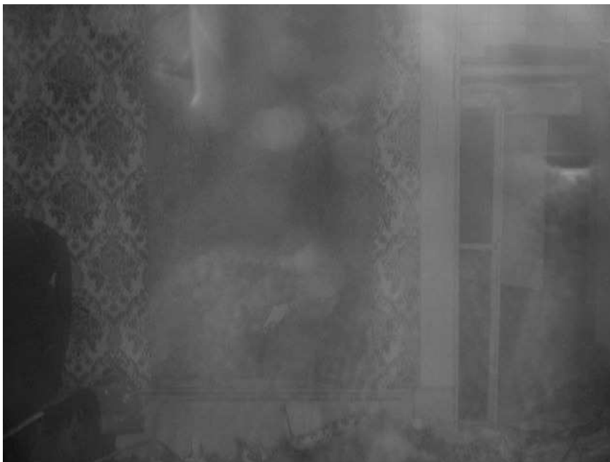
Foto gemaakt door een echtpaar uit Ossensisse in maart 2007 bij de Jufferschans in Uzendijke. (Via Youtube kunt u de boektrailer bekijken, zodat u deze foto in kleur kunt zien.)

het midden is een menselijke gedaante te zien die mogelijk een baby in een doodskleed vasthoudt.