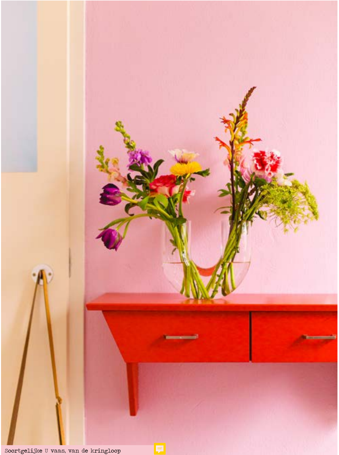
Soortgelijke U vaas, van de kringloop