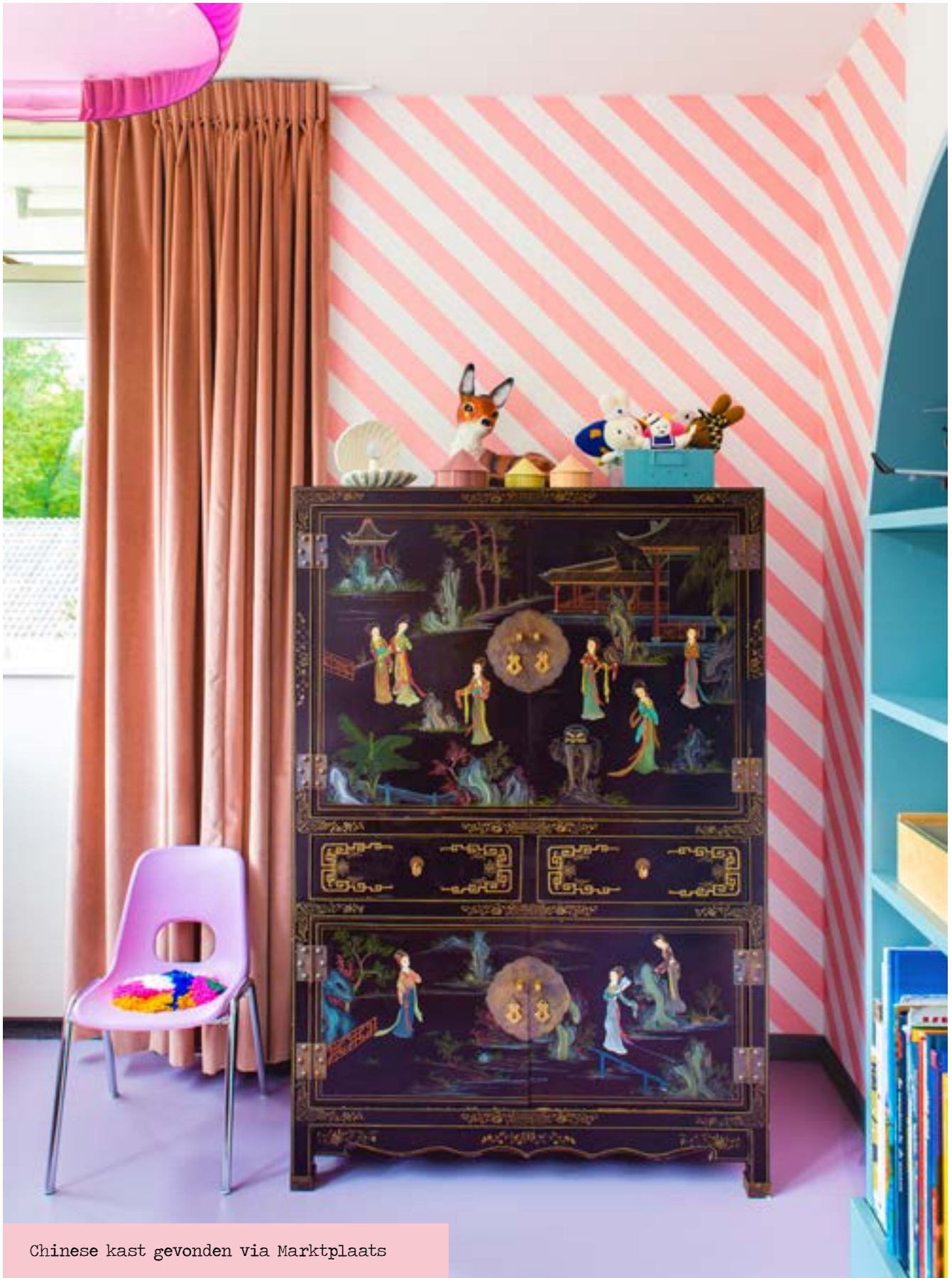
Chinese kast gevonden via Marktplaats