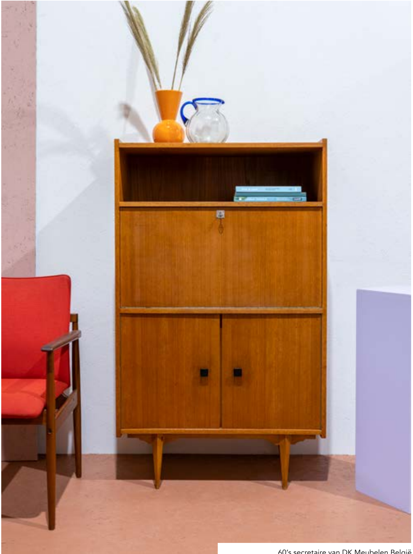
60's secretaire van DK Meubelen België