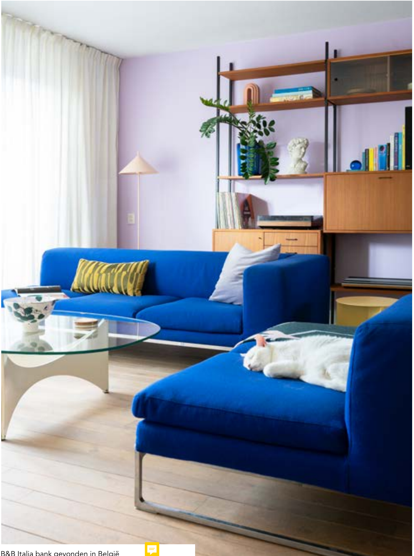
B&B Italia bank gevonden in België