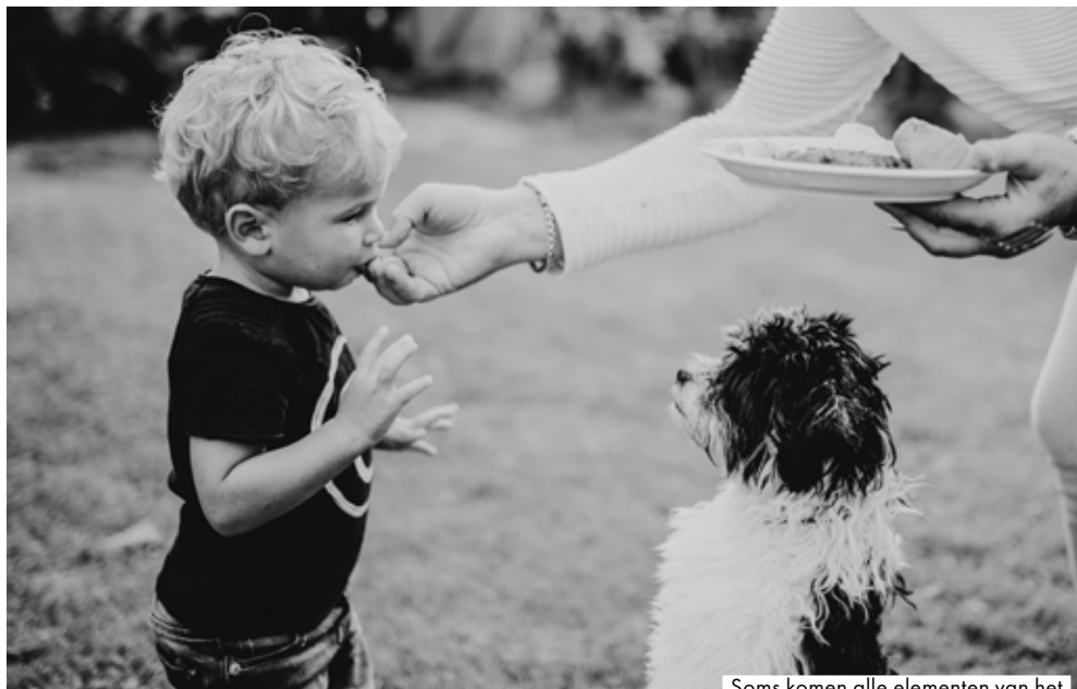
Soms komen alle elementen van het beslissende moment perfect samen, zoals bij deze foto's. Een spontaan verhalend moment gevangen in de juiste compositie.