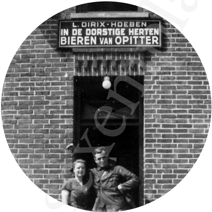
Herberg In de Dorstige Herten. Met onbekende bezoekers. De achternamen van de uitbaters zijn om een onbekende reden foutief gespeld.