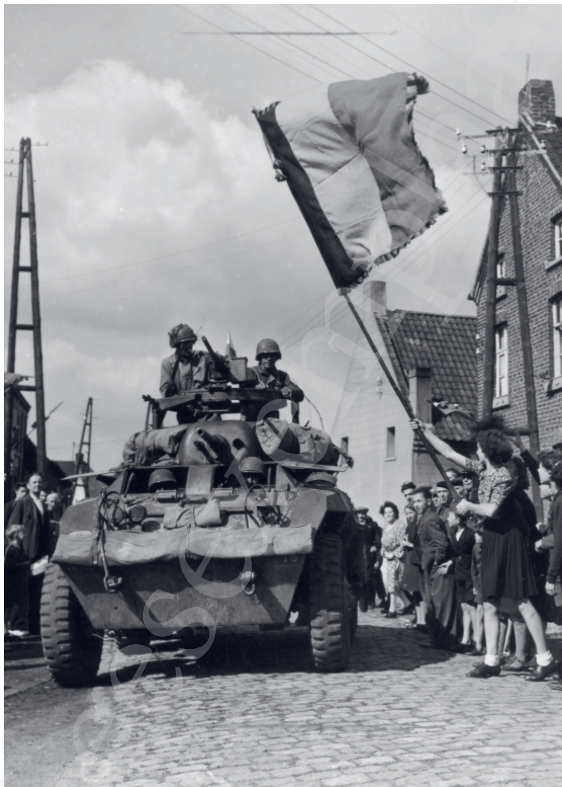
Intrede van de Amerikaanse troepen in Rongy.