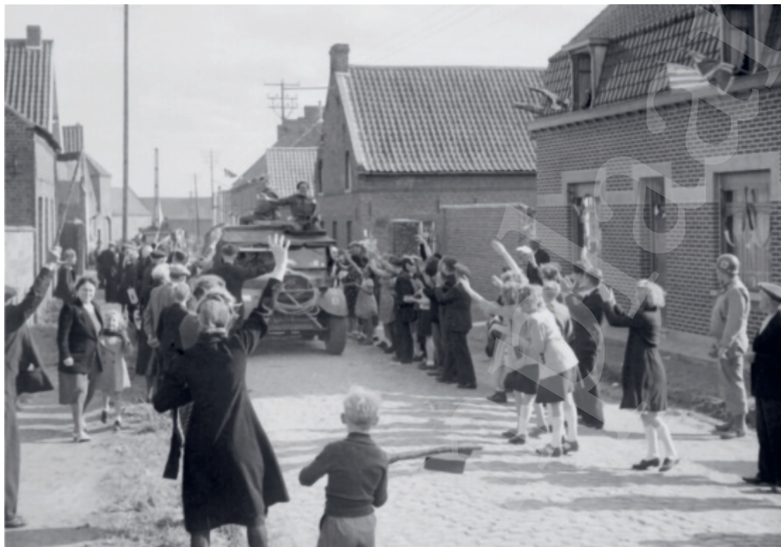
Intrede van de Brigade Piron in Rongy.