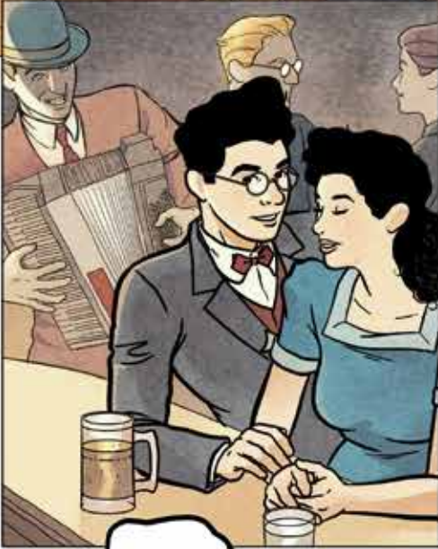
IS ZE ZO MOOI?