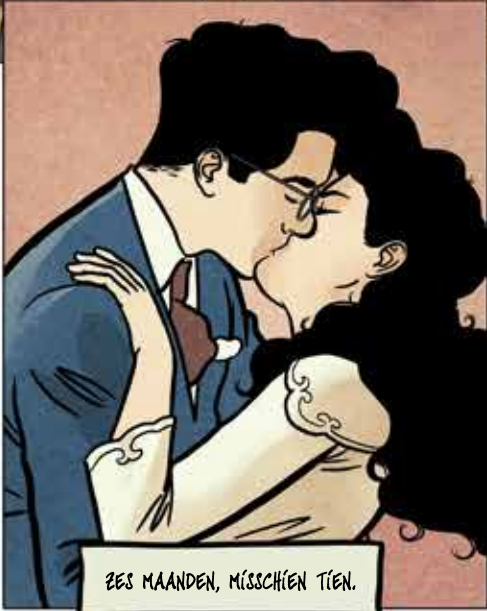
ZES MAANDEN, MISSCHIEN TIEN.