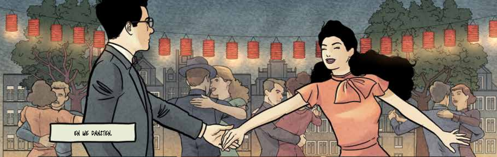
EN WE DANSTEN.