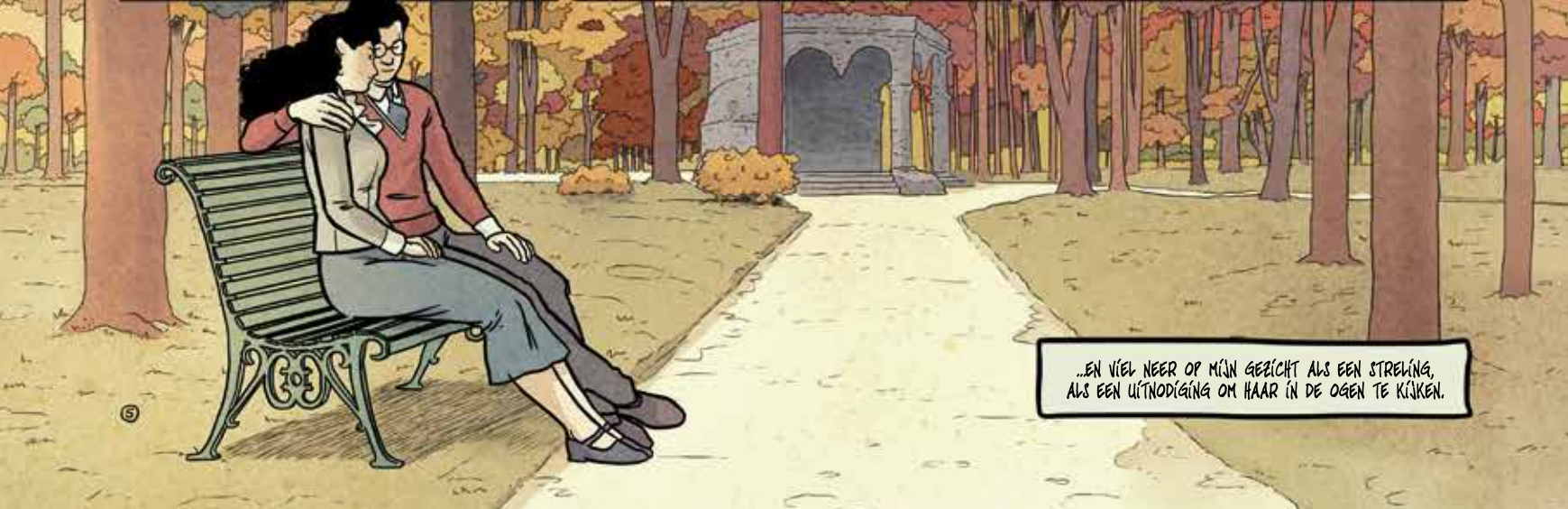
...EN VIËL NEËR OP MÏN GËBÏCHT ALS EËN STRELVING, ALS EËN UITNODIGING OM HAAR IN DE OGEN TE KÏKKEN.