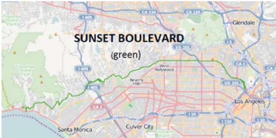
De route: Sunset Blvd, Los Angeles

Vandaag is de dag. Vandaag gaan we de Grand Tour doen. Lekker lui cruisen over Sunset Boulevard, de aorta van Los Angeles. Locaties hoppen, met de popcultuur als rode draad. Hollywood à gogo .