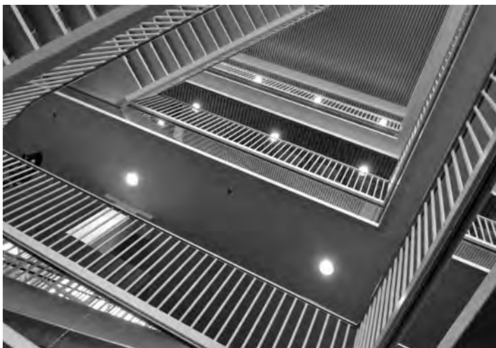
Het trappenhuis in de Galgenwaard

Op die ochtend van maandag 3 september 2007 was er sprake van tweerichtingsverkeer. De komende man ging met zijn entourage omhoog. De gaande man pakte in zijn eentje de roltrap naar beneden. Halverwege kruisten ze elkaar. De komende man knikte even, de gaande man zou zich daar later niets van kunnen herinneren. Een koningsdrama in de Galgenwaard. Oude koning eruit, nieuwe koning erin. Zoals het onnavolgbare lokale idiolect zou zeggen: Utrege toestanden . Daar waren er bij de club wel meer van, maar in vijftig jaar FC Utrecht moet dit toch wel de meest surrealistische van alle Utrechtse toestanden zijn geweest.