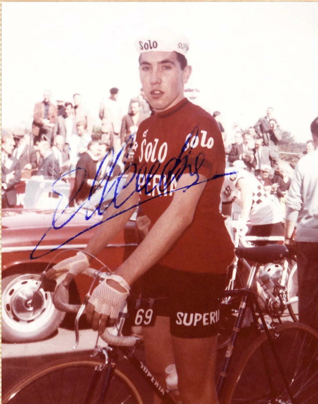
2de nationaal kampioenschap, Vilvoorde 1965