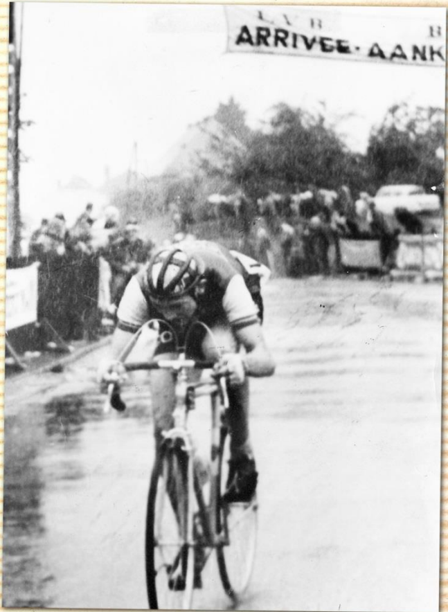
winst Aspelare 1962