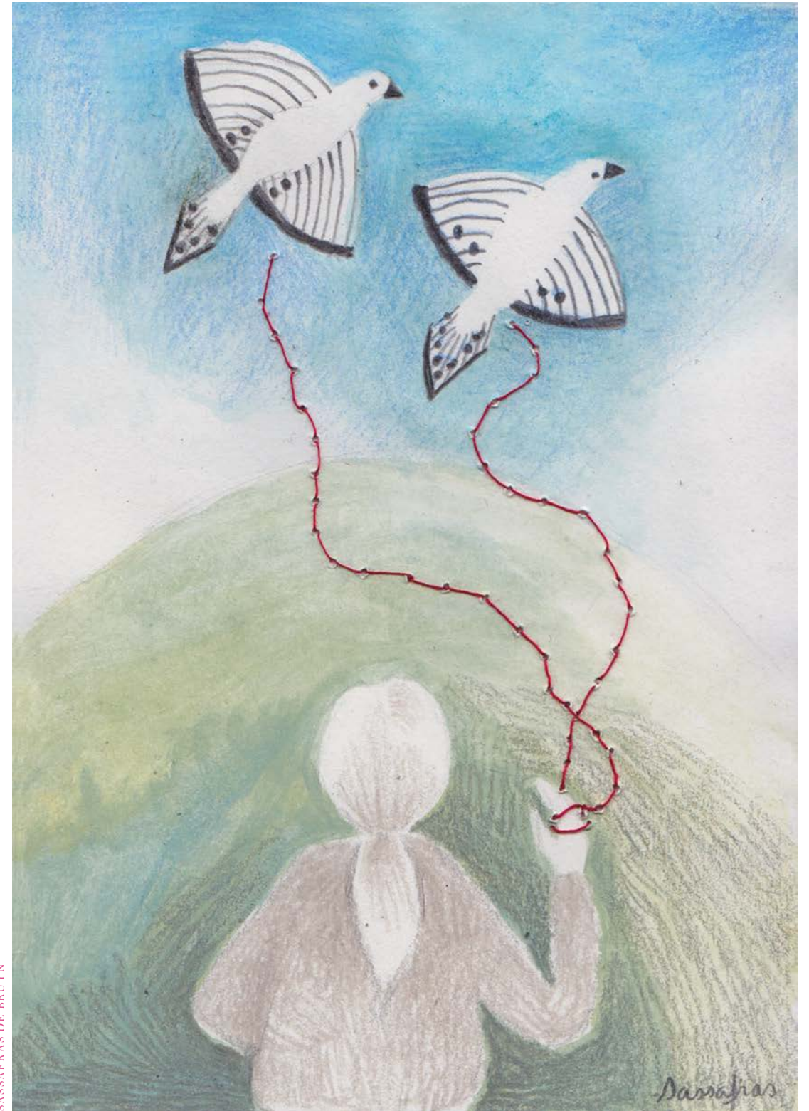
SASSAFRAS DE BRUYN