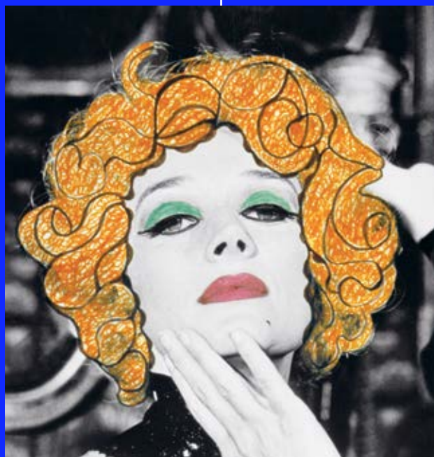
FILM-STILL OF 'DADDY', 1972.

'I could not identify with Mother, our grandmothers, our aunts, or Mother's friends. Their territory seemed too