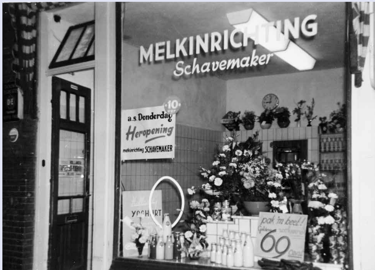
De etalage van 'Schavemaker Melkslijterijen' in de Van der Hoopstraat in Amsterdam in de jaren 1950.