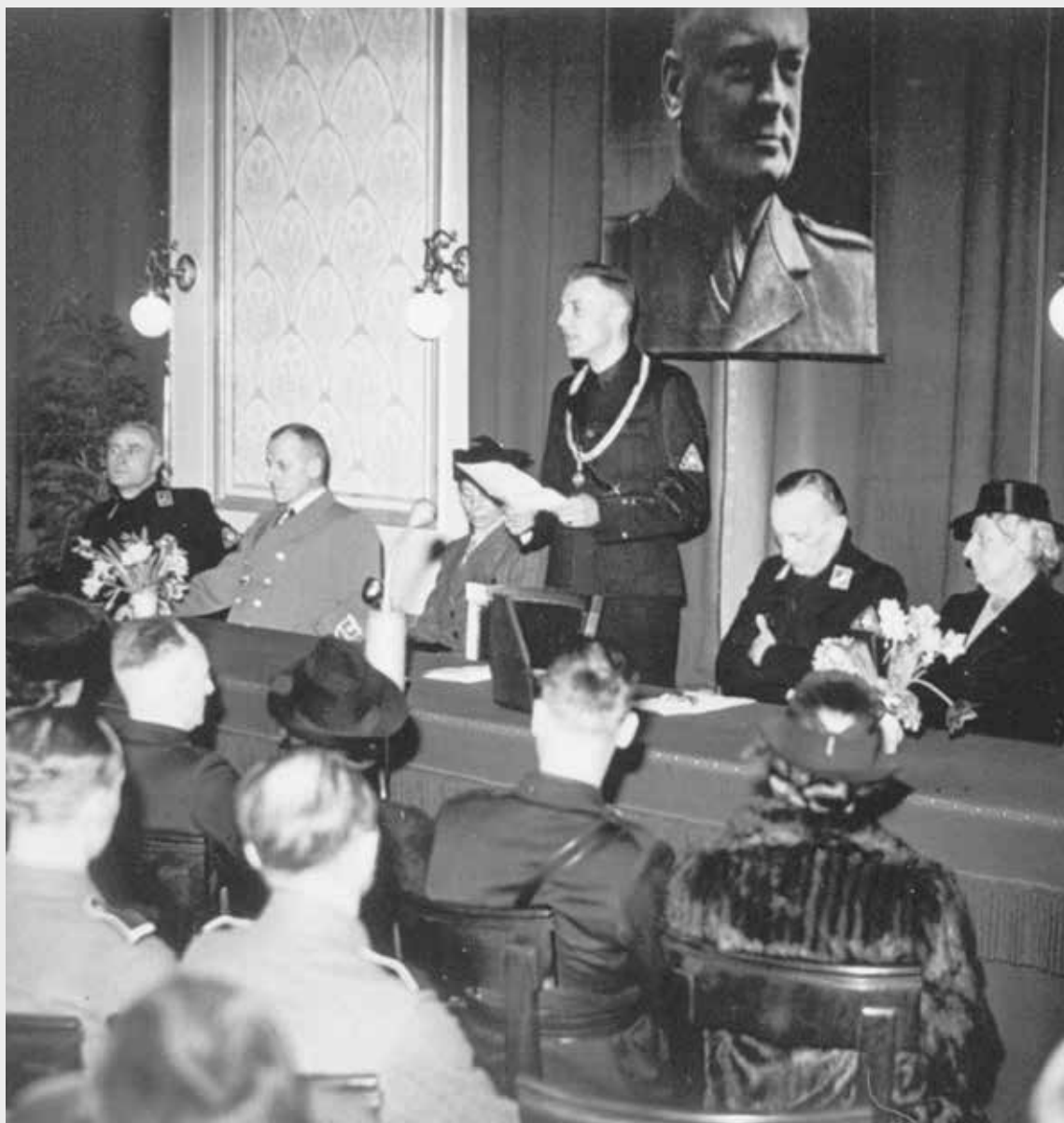
Installatie van NSB'er Petrus Tammens als burgemeester van Groningen in de raadszaal van het stadhuis, 4 maart 1943.