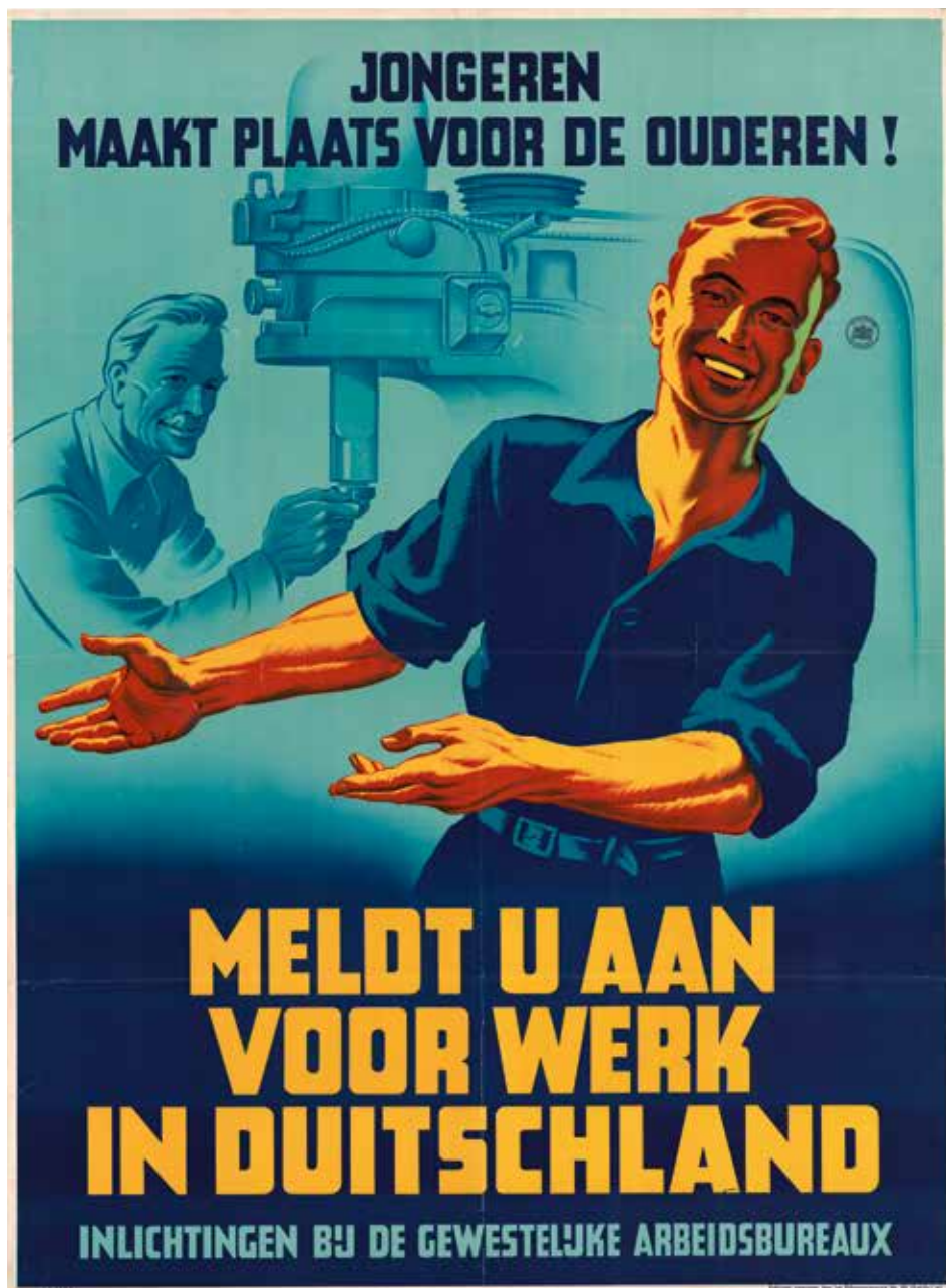
Affiche van de Gewestelijke Arbeidsbureaus om Nederlandse mannen aan te sporen zich aan te melden voor werk in de Duitse industrie. In februari 1942 voert de bezetter de arbeidsinzet in: gedwongen tewerkstelling in Duitsland voor mannen van zeventien tot veertig jaar. Tussen 15 mei en 15 juli 1942 hangt dit affiche op verschillende plekken in Nederland.