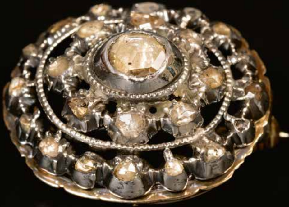
Broche, goud, zilver en roosgeslepen diamanten, West-Friesland, ca. 1860, particuliere collectie