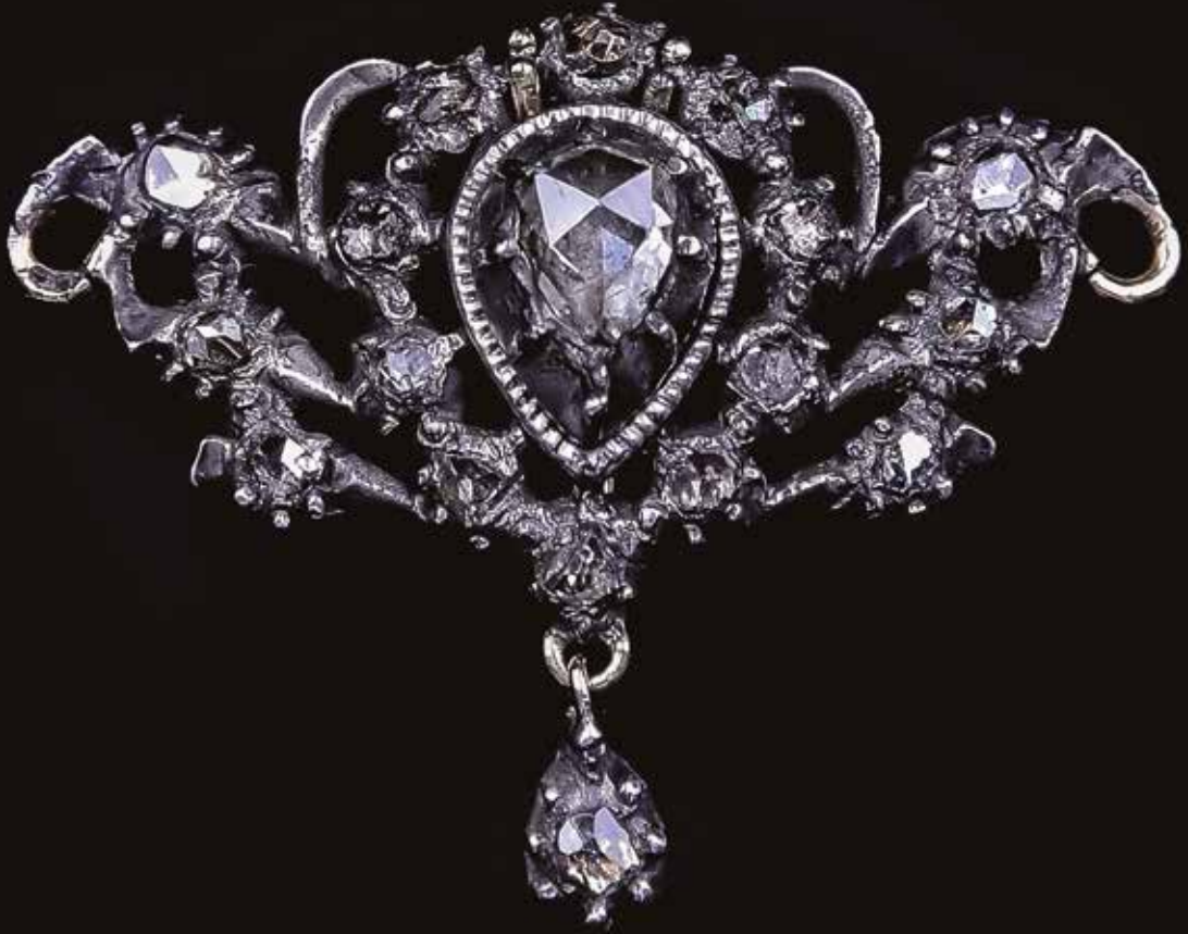
Streekferronnière, goud, zilver en roosgeslepen diamanten, Alkmaar, ca. 1880, coll. auteur