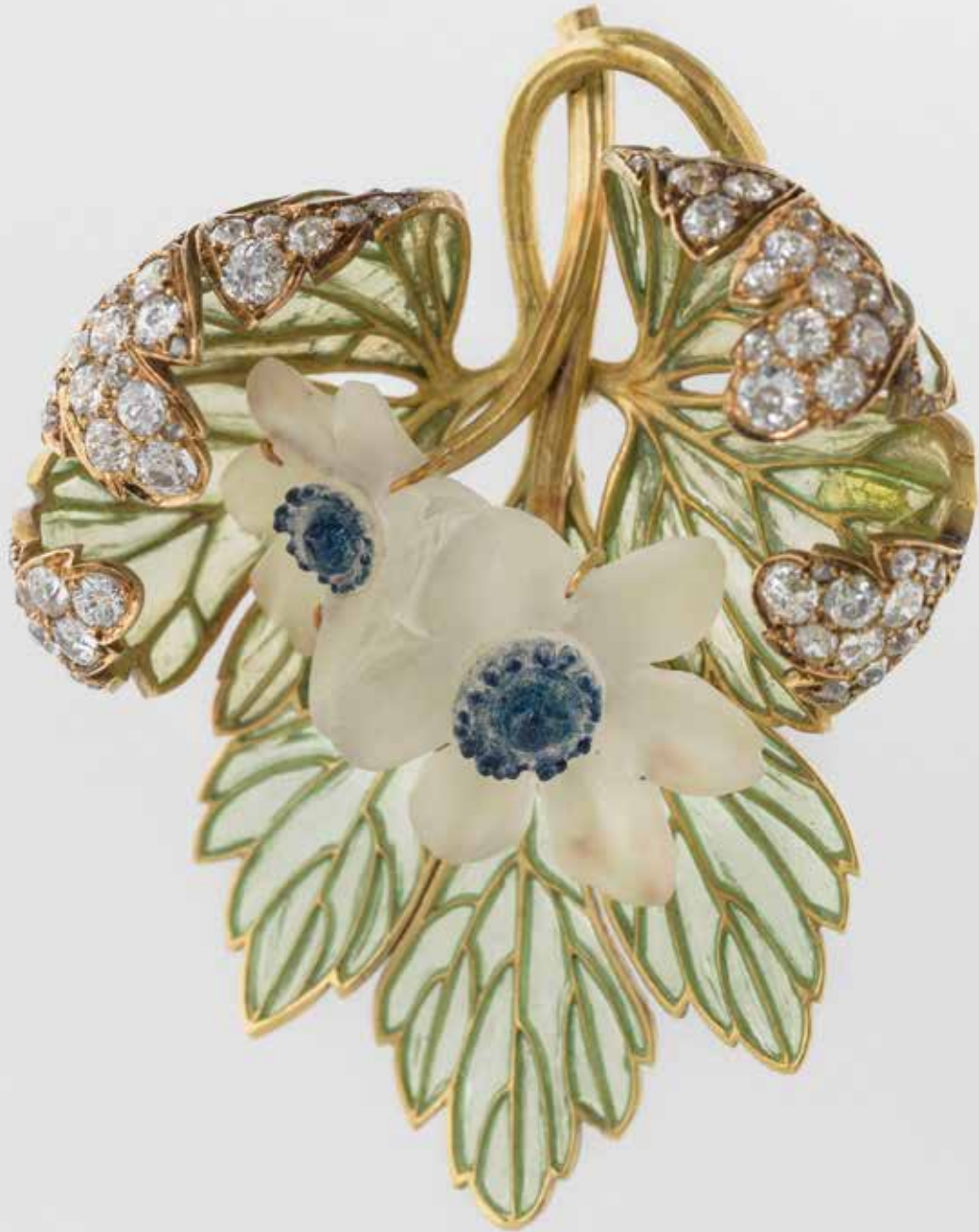
Hanger, goud, briljantgeslepen diamanten, glas en vensteremail, René Lalique, Parijs, 1902-1903, coll. museum Petit Palais, Parijs