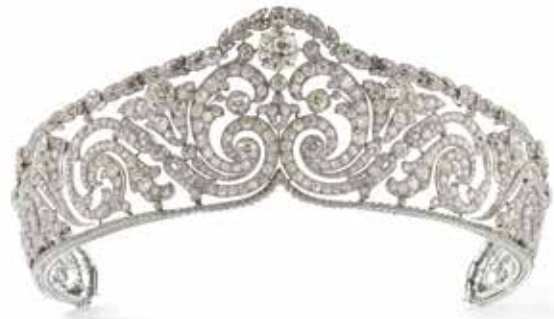
Diadeem, platina en briljant geslepen diamanten. Cartier Parijs, 1912 voor koningin Elisabeth van België, collectie Cartier