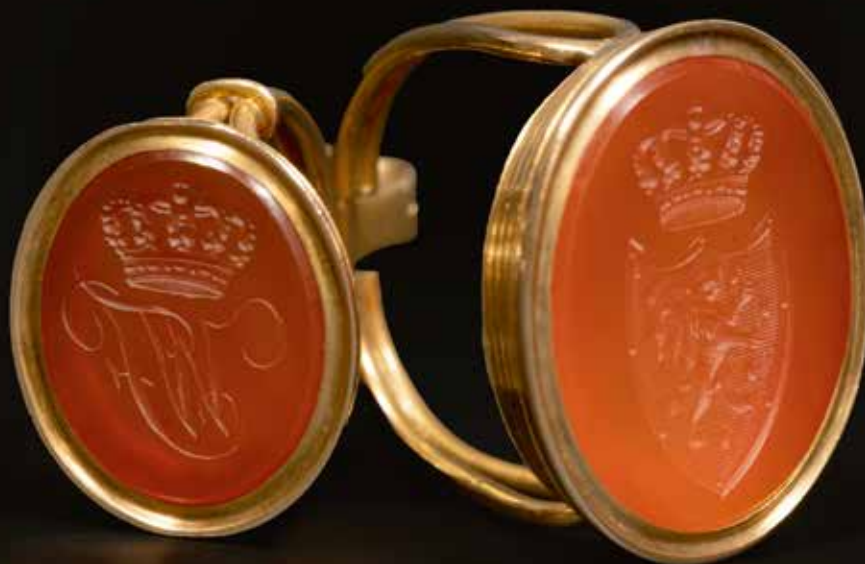
Dubbel-cachet, goud en gegraveerde kornalijn, met wapen en initialen van koning Willem I, Nederland, ca. 1840, coll. auteur, foto Arend Velsink BOVEN Dubbel-cachet in opengeslagen toestand