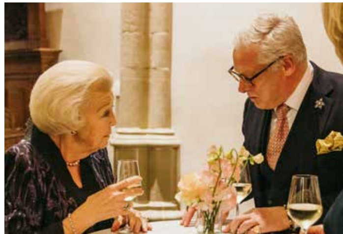
Prinses Beatrix en de auteur tijdens de opening van de tentoonstelling 'De eeuw van Juliana' in De Nieuwe Kerk in Amsterdam, 2022

Hier wil ik mijn fascinatie voor de verhalen achter juwelen overbrengen. Het doorgeven ervan is uiteindelijk een passie op zich geworden, die ik in de loop van de jaren ben gaan beschouwen als een 'raison d'être'. En ik hoop dat Sprekende juwelen daar een bijdrage aan mag leveren, als een soort voorlopige terugblik op mijn leven in juwelen.