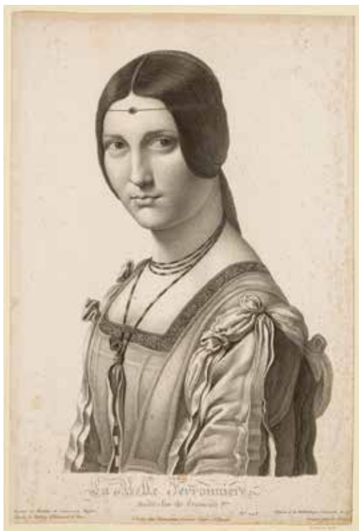
La belle ferronnière , Jean-Auguste Dominique Ingres, Parijs, ca. 1805. Naar Da Vinci, coll. Bibliothèque Nationale de France

De mevrouw aan de telefoon had een krachtige, heldere stem, maar vertelde dat ze inmiddels toch echt al bijna 99 jaar oud was, geen kinderen had en mij iets wilde geven: 'een ferronnière, maar dan moet u wel gauw naar Heiloo komen, want zo lang heb ik niet meer de tijd'.