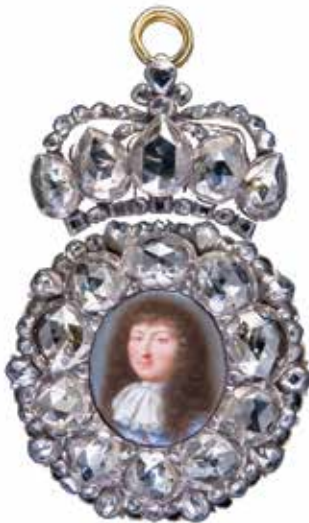
'Boîte à portrait', goud, zilver, roosgeslepen diamanten en geëmailleerd portret van koning Lodewijk XIV, Parijs, ca. 1700, coll. Louvre Parijs, voorheen coll. Yves Saint Laurent