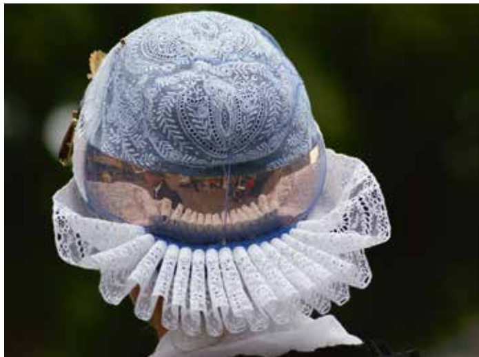
Achterzijde West-Friese hoofddracht met gouden oorijzer