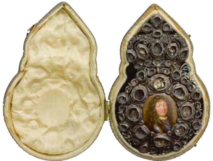
'Boîte à portrait', goud, zilver en geëmailleerd portret van koning Lodewijk XIV in origineel etui, ca. 1700, coll. Kunstmuseum Den Haag, oorspronkelijk van Anthonie Heinsius (1641-1720)