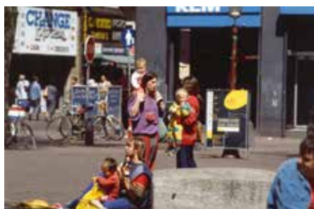
AMSTERDAM circa 1971

Een hippie-gezin op de Dam in Amsterdam. De naam 'hippie' raakt eind jaren '60 in zwang en is afkomstig van jongeren in New York die zich 'hip' noemen, in tegenstelling tot de 'square', de burgerman die zich aan de regels van de Westerse samenleving houdt. Voor de Nederlandse hippies is de Dam de 'heilige plaats', waar zij samen met hippies uit het buitenland het Nationaal Monument verkozen hebben tot dagverblijf en slaappleats. Daar zijn zij 'onder elkaar', in hun non-conformistische en kleurige kleding, de lange haardracht, een afwijkend taalgebruik en het (gezamenlijk) gebruik van softdrugs als marihuana en 'hasjiesj'.