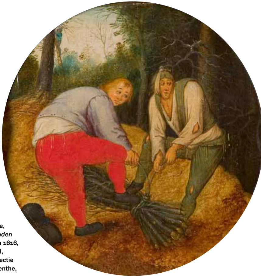
[afb. 18] Pieter Brueghel de Jonge, Twee mannen binden takken samen , na 1616, olieverf op paneel, diam. 18 cm. Collectie Rijksmuseum Twenthe, Enschede