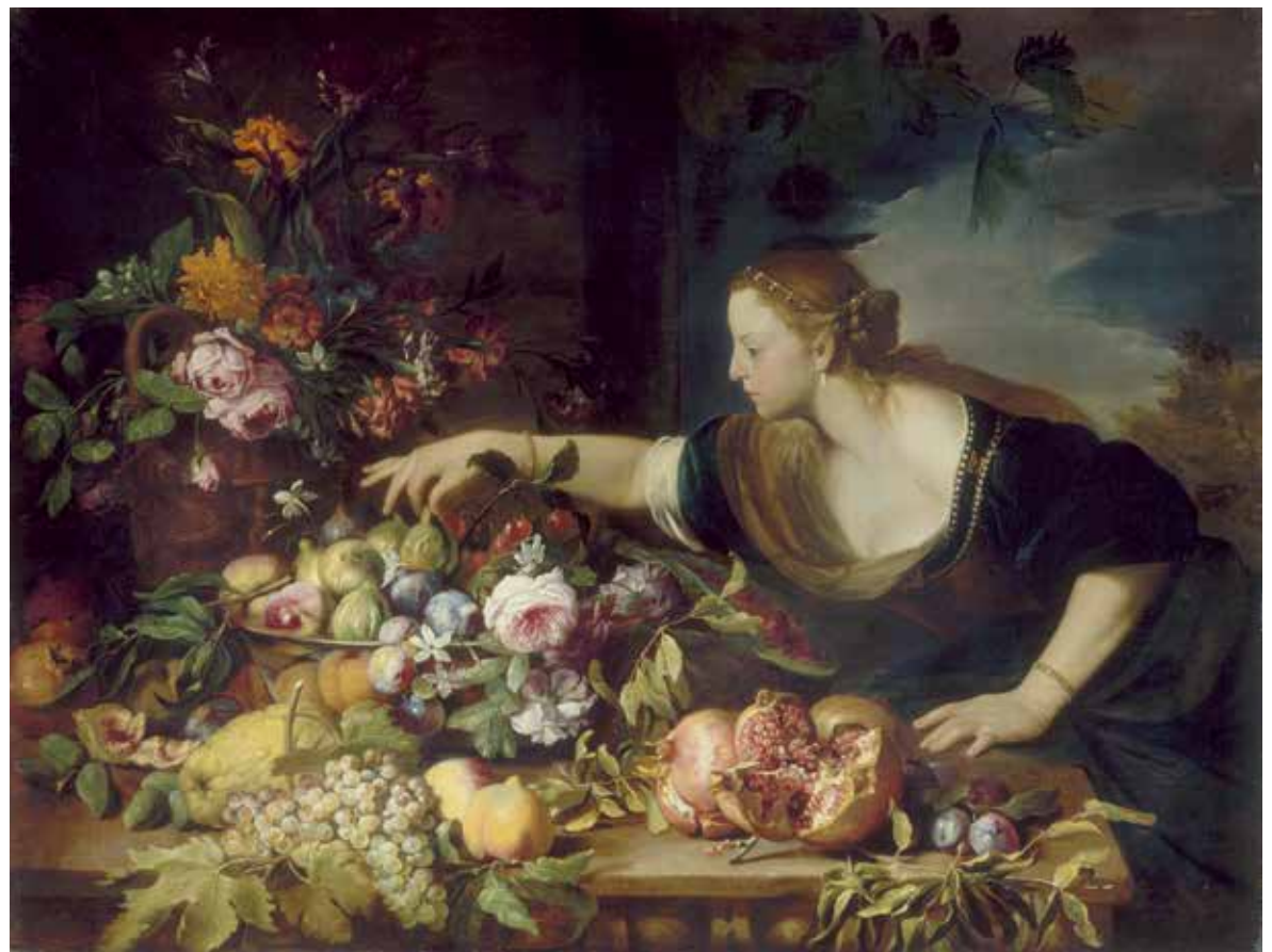
[afb. 19] Abraham Brueghel, Vrouw pakt een vrucht van een schaal met bloemen en vruchten , 1669, olieverf op doek, 128 x 149 cm. Parijs, Musée du Louvre Afdeling Schilderijen - Schenking van André Pereire, 1949