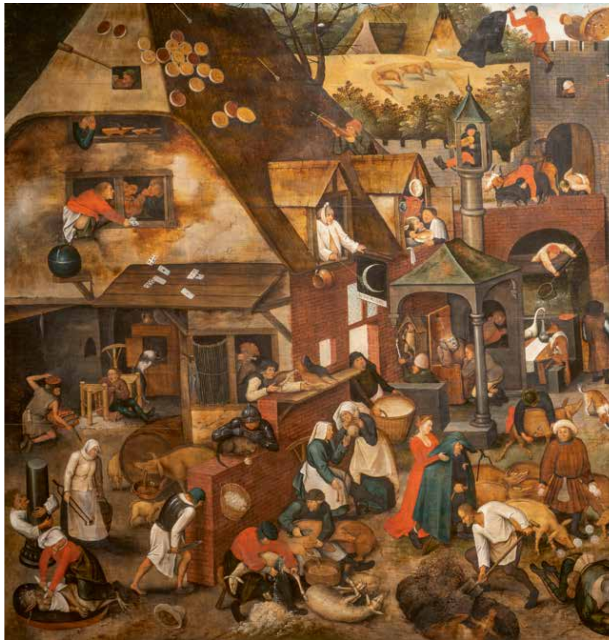
[afb. 1] Pieter Bruegel de Jonge, De Vlaamse spreekwoorden , 1607, olieverf op paneel, 116 x 168 cm. Stadsmuseum Lier

iconische als minder bekende kunstwerken van een nieuwe context en brengen het verleden dichterbij het grote publiek, waaronder mensen die voor het eerst met de familie Bruegel kennismaken.