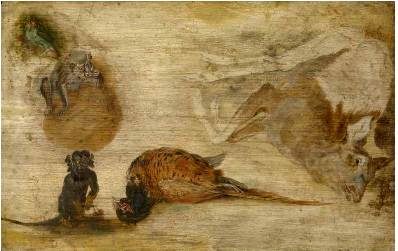
[afb. 51] Jan Brueghel de Oude, Studie van apen, een hert en andere dieren , ca. 1620, olieverf op paneel, 20 x 31 cm. Museum voor Schone Kunsten, Gent

Het katholieke gebruik om bloemenkransen rond religieuze schilderijen te hangen stond aan de basis van het nieuwe genre van de Madonna met bloemenkrans. Een grote bewondering voor de variatie en schoonheid van de natuur kwam hier samen met een allegorische blik op de natuur, zoals verwoord door de jezuïeten. De Madonna met kind in een bloemenkrans van Jan Brueghel de Oude en Peter Paul Rubens [afb. 48] is een voorbeeld: natuurschoon in combinatie met een religieus middenstuk – dat moest oproepen tot devotie en 'goede werken'. Een soortgelijk schilderij maakten de twee voor kardinaal Borromeo in Milaan (nu in het Prado). In zijn traktaat Musaeum (1625) schrijft Borromeo over dit schilderij: 'Little birds sit amongst