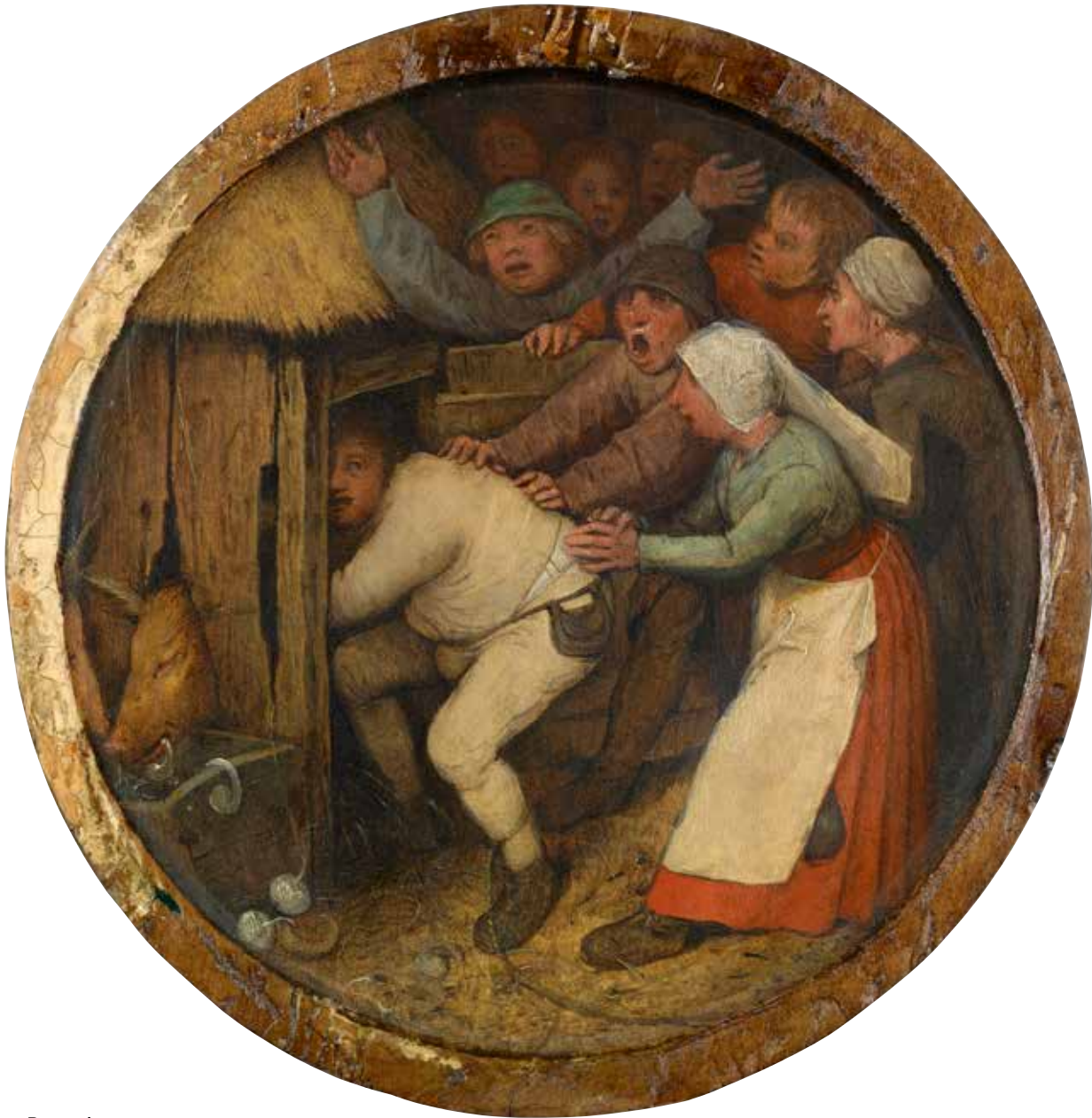
[afb. 17] Pieter Bruegel de Oude, De dronkaard in de varkensstal geduwd , 1557, olieverf op paneel, diam. 20 cm. Particuliere collectie

Jan was net als zijn vader een van de vele kunstenaars uit de familie Brueghel die gegrepen werd door de aantrekkingskracht van Italië. De Italiaanse reis van Pieter Bruegel de