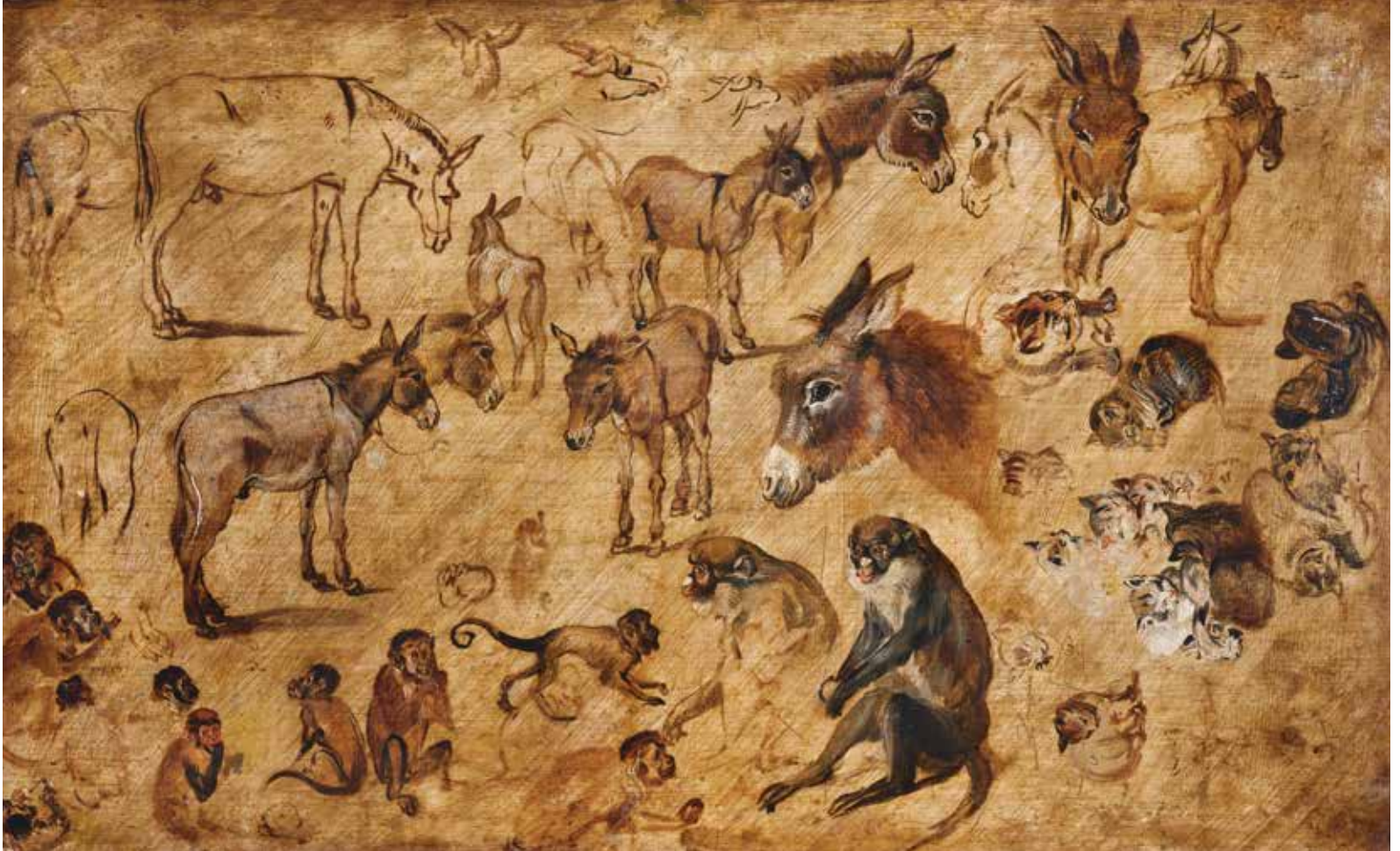
[afb. 52] Jan Bruegel de Oude, Dierenstudie (ezels, katten, apen) , ca. 1613, olieverf op paneel, 34 x 55,5 cm. Kunsthistorisches Museum Vienna, Picture Gallery