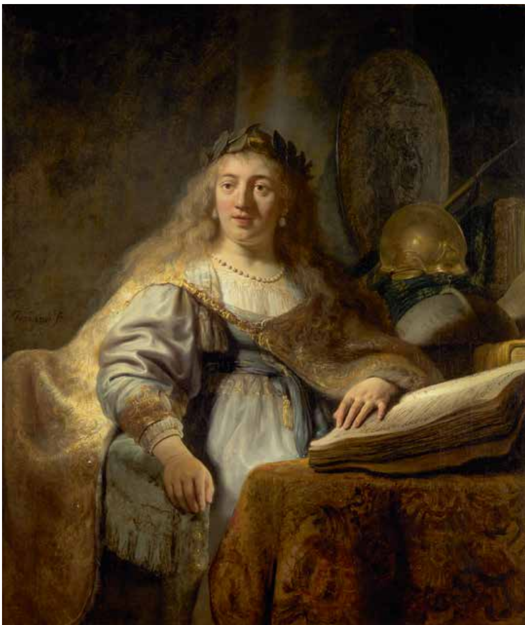
Rembrandt van Rijn, Minerva in haar studeervertrek , 1635 (cat. 7)