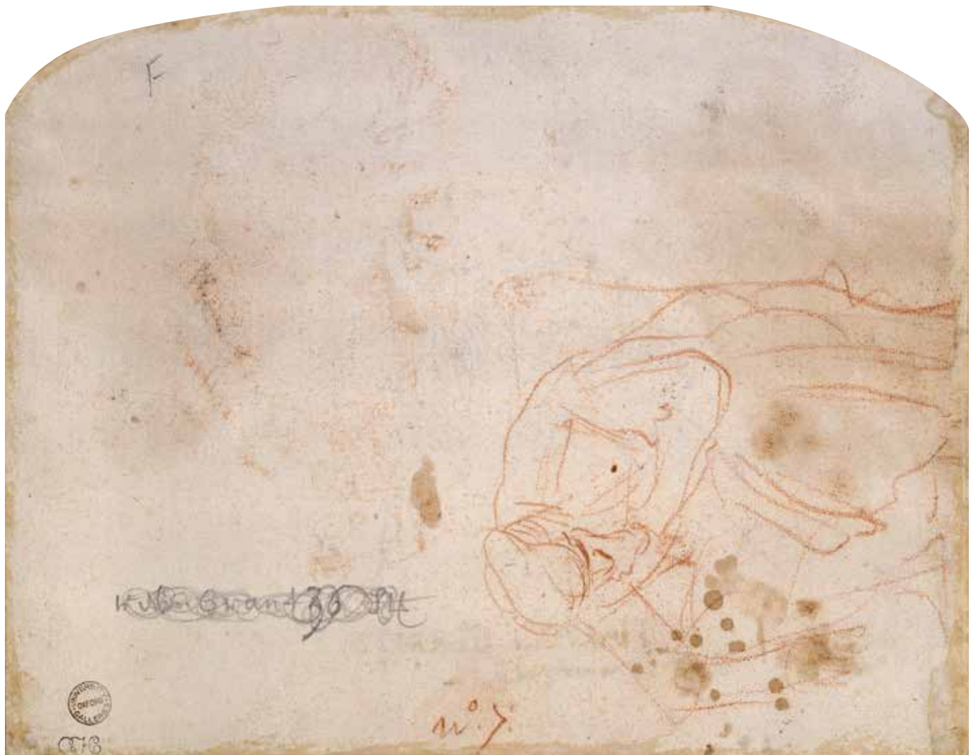
Afb. 4a Verso: kleine figuurstudie, rood krijt

De twee andere figuurstudies werden met penseel afgedekt. Ter ere van zijn vader heeft Rembrandt de naam met hoofdletters geschreven.