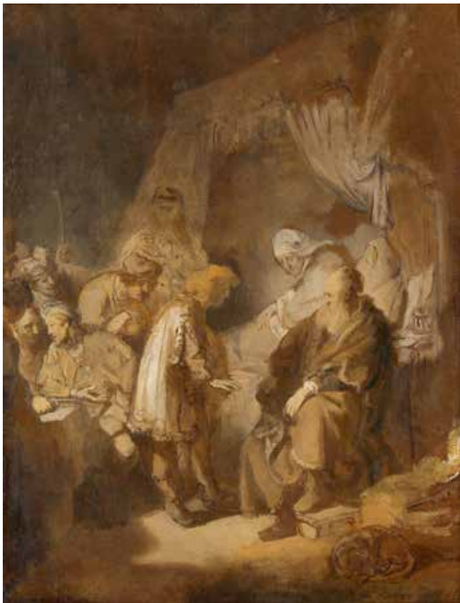
Afb. 6a Rembrandt Jozef vertelt zijn dromen Grisaille, papier op karton, 55,6 × 39,7 cm Gesigneerd: Rembrandt f. 1633 Amsterdam, Rijksmuseum inv. SK-A-3477

brenge en werd vervolgens door zijn jaloerse broers verkocht (cat. 33); later werd hij onderkoning van Egypte (Genesis 37: 1-36). Op het schilderij met een hoger gezichtspunt werd de linker voet op een stoof geplaatst. In 1638 maakte Rembrandt een ets met hetzelfde onderwerp, waar de zittende man ook op voorkomt (afb. 6b).