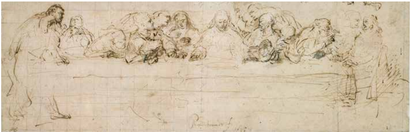
Afb. 14a Rembrandt Het laatste avondmaal Pen in bruin, penseel in bruin en wit, enig rood krijt, 125/129 × 385 mm Gesigneerd: Rembrandt f. 1635 Berlijn, Staatliche Museen zu Berlin, Kupferstichkabinett inv. KdZ 3769

Ik verzeker jullie: een van jullie zal Mij uitleveren (Matteüs 26: 21). Jezus zit in het midden onder een baldakijn en Judas, de verrader, de vierde figuur van links, leunt achterover. Er zijn nog twee tekeningen van dit onderwerp, een die alleen het linker gedeelte weergeeft (Londen, British Museum) en de uiteindelijke versie met de pen van 1635 in Berlijn (afb. 14a).