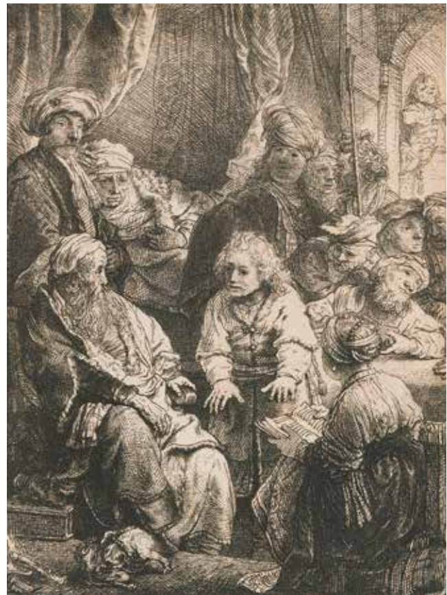
Afb. 6b Rembrandt Jozef vertelt zijn dromen Ets, 110 × 83 mm Gesigneerd: Rembrandt f. 1638 Amsterdam, Rijksmuseum inv. RP-O-OB-76