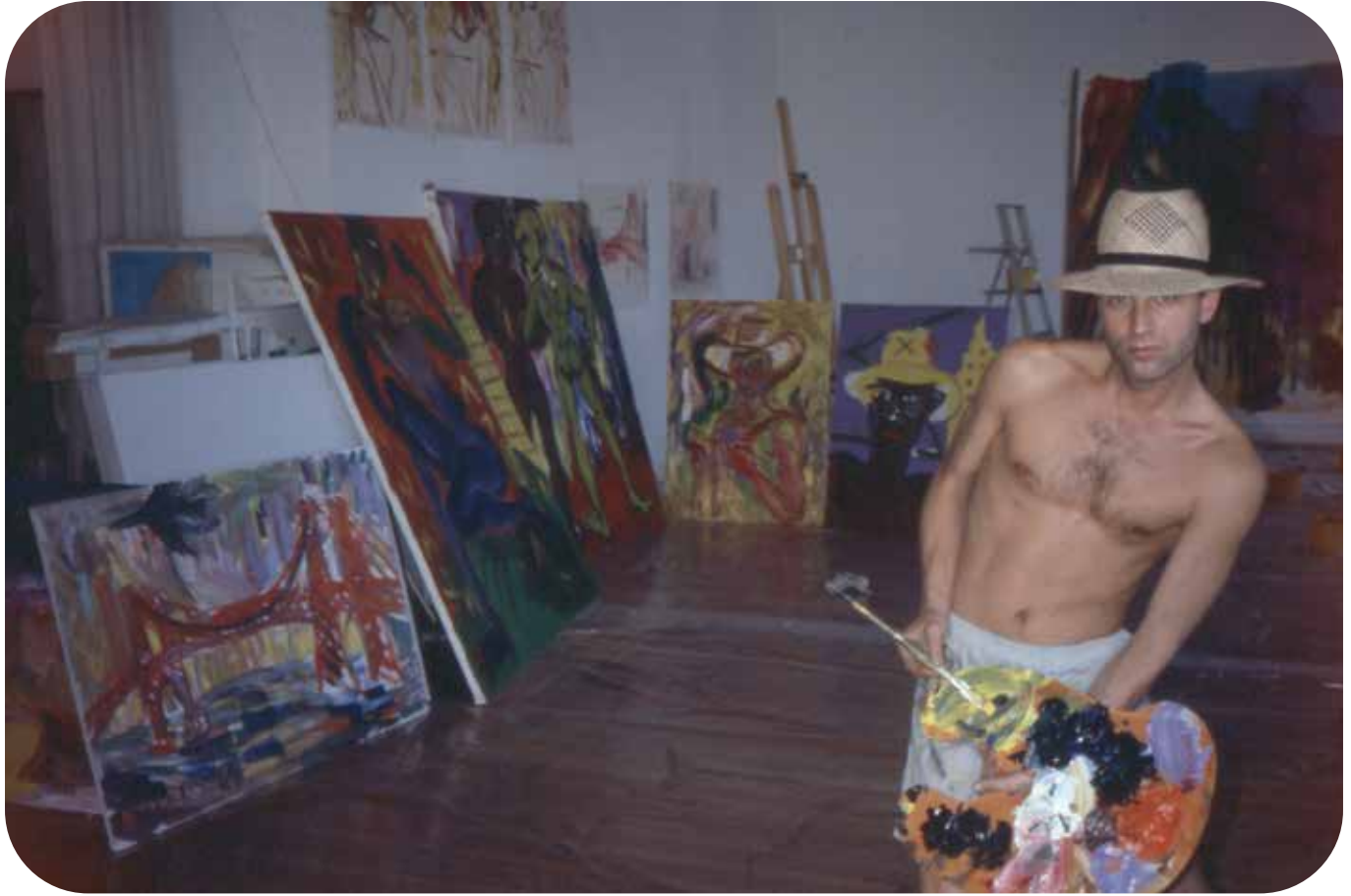
Rainer Fetting as the "New York Painter", Studio loft, Williamsburg, Broadway, Brooklyn, New York 1983