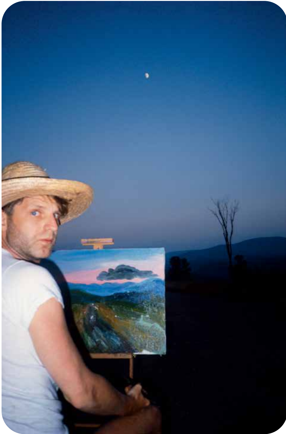
Self in the Catskills, Hudson River Valley 1986