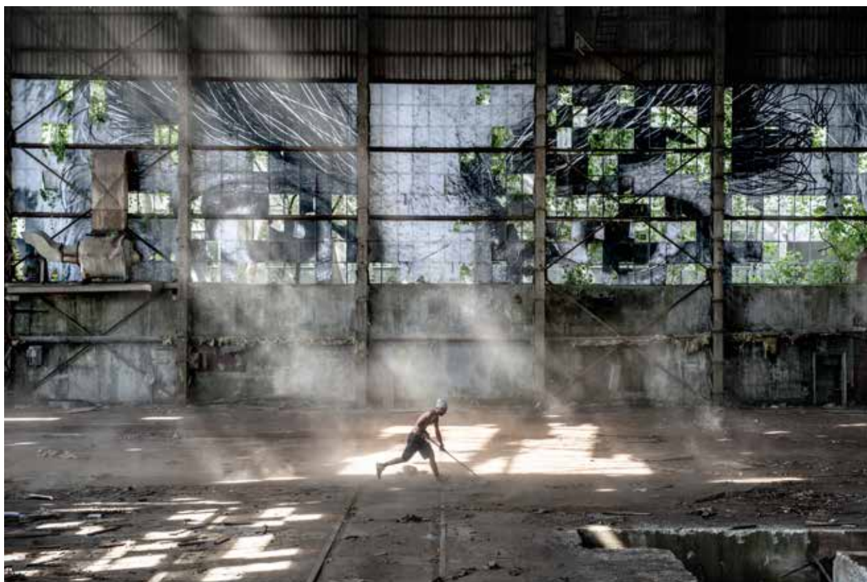
The Wrinkles of the City Istanbul (van boven naar beneden): Ismet Erkoç Eye , 2015; Kadir An Eyes , 2015