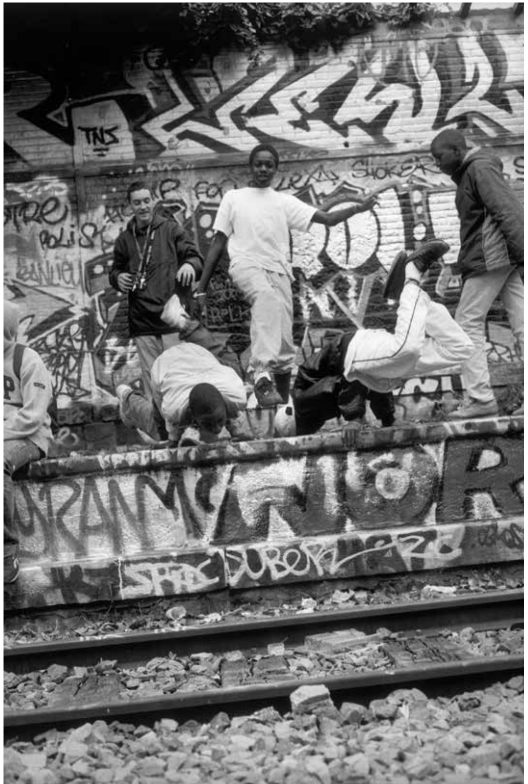
Expo 2 Rue