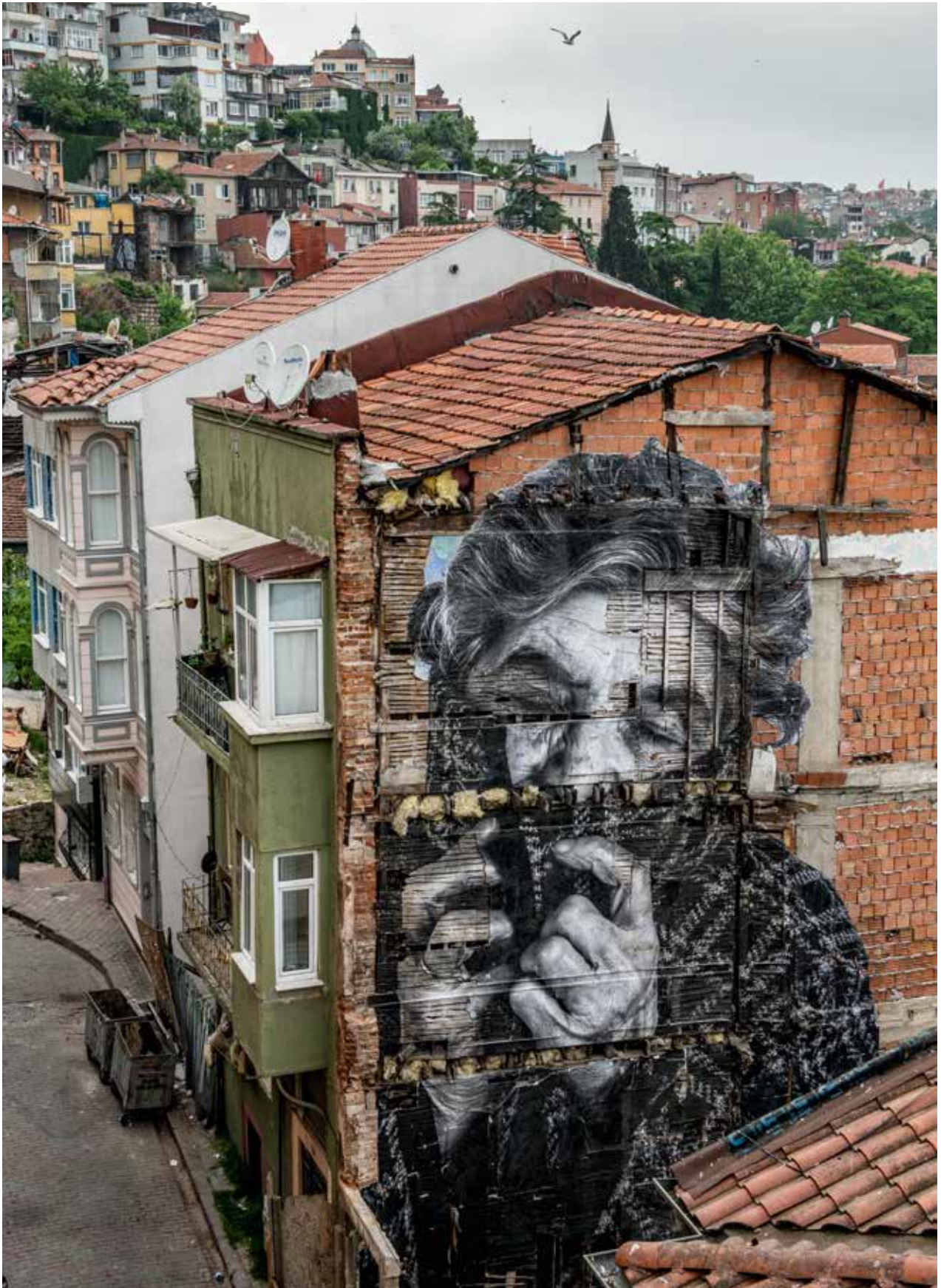
The Wrinkles of the City Istanbul Ayşe Vural , 2015