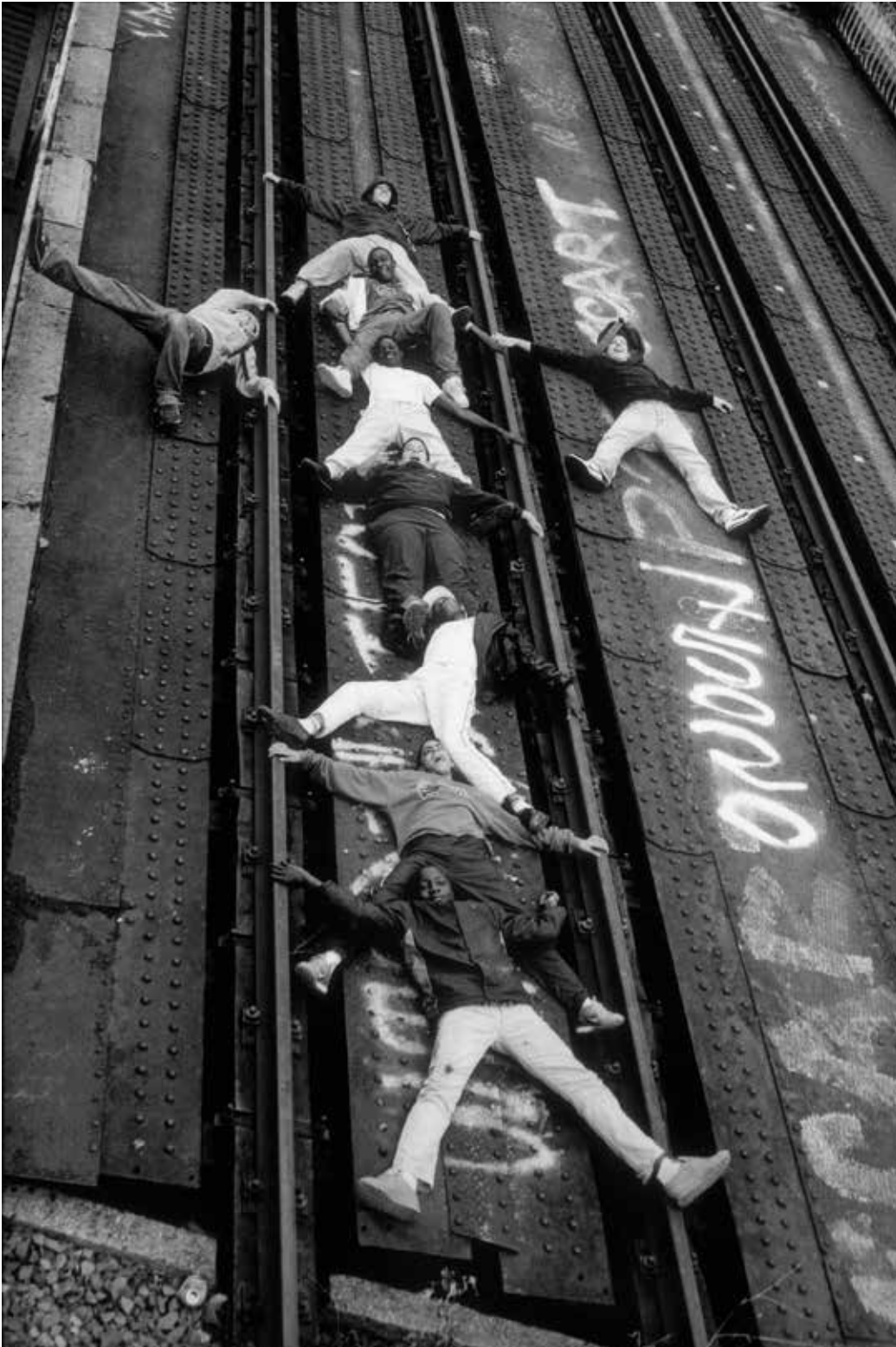
Expo 2 Rue ROLK, Youths from the 20th Arrondissement, Parijs, 2002