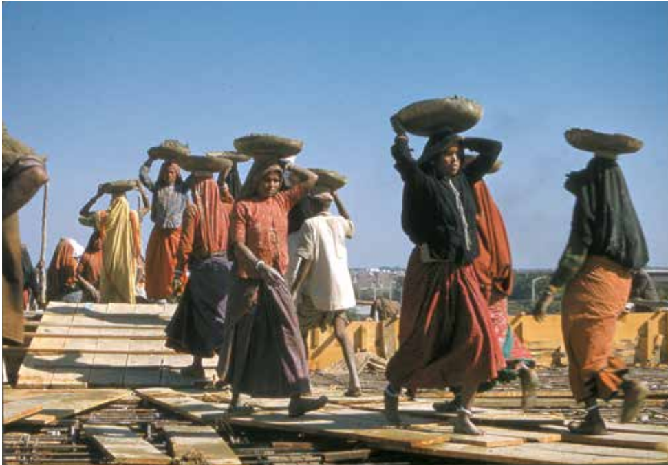
Afb. 47. Bij de bouw van de nieuwe woning van de Amerikaanse ambassadeur in New Delhi in 1962 brengen seizoenarbeidsters uit Rajasthan

aangemaakte cementspecie in schotels op hun hoofd naar de bouwplaats, waar hun mannen aan het werk zijn.