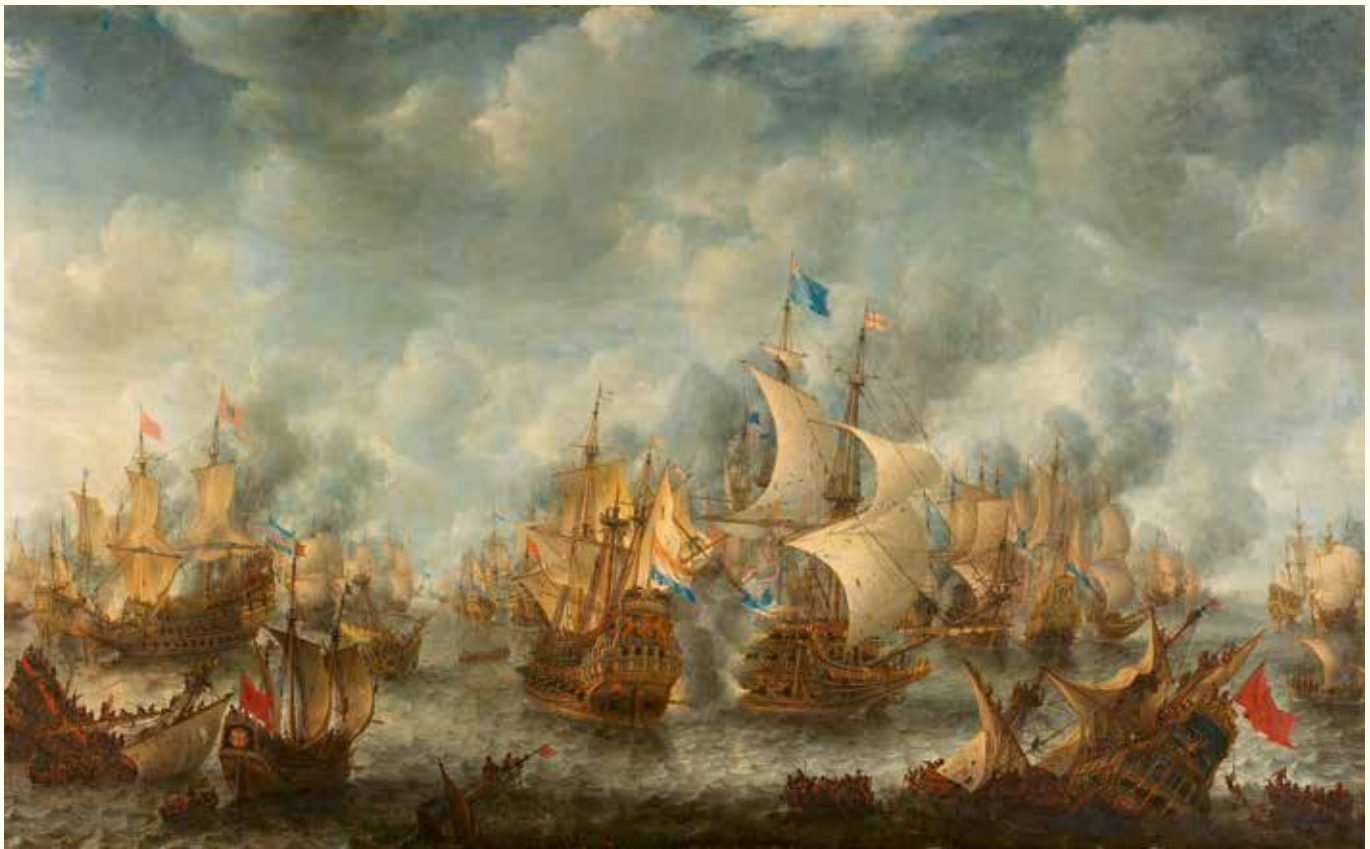
17 Jan Abrahamsz. Beerstraten, Slag bij Terheide (10 augustus 1653) , 1653-1666. Amsterdam, Rijksmuseum