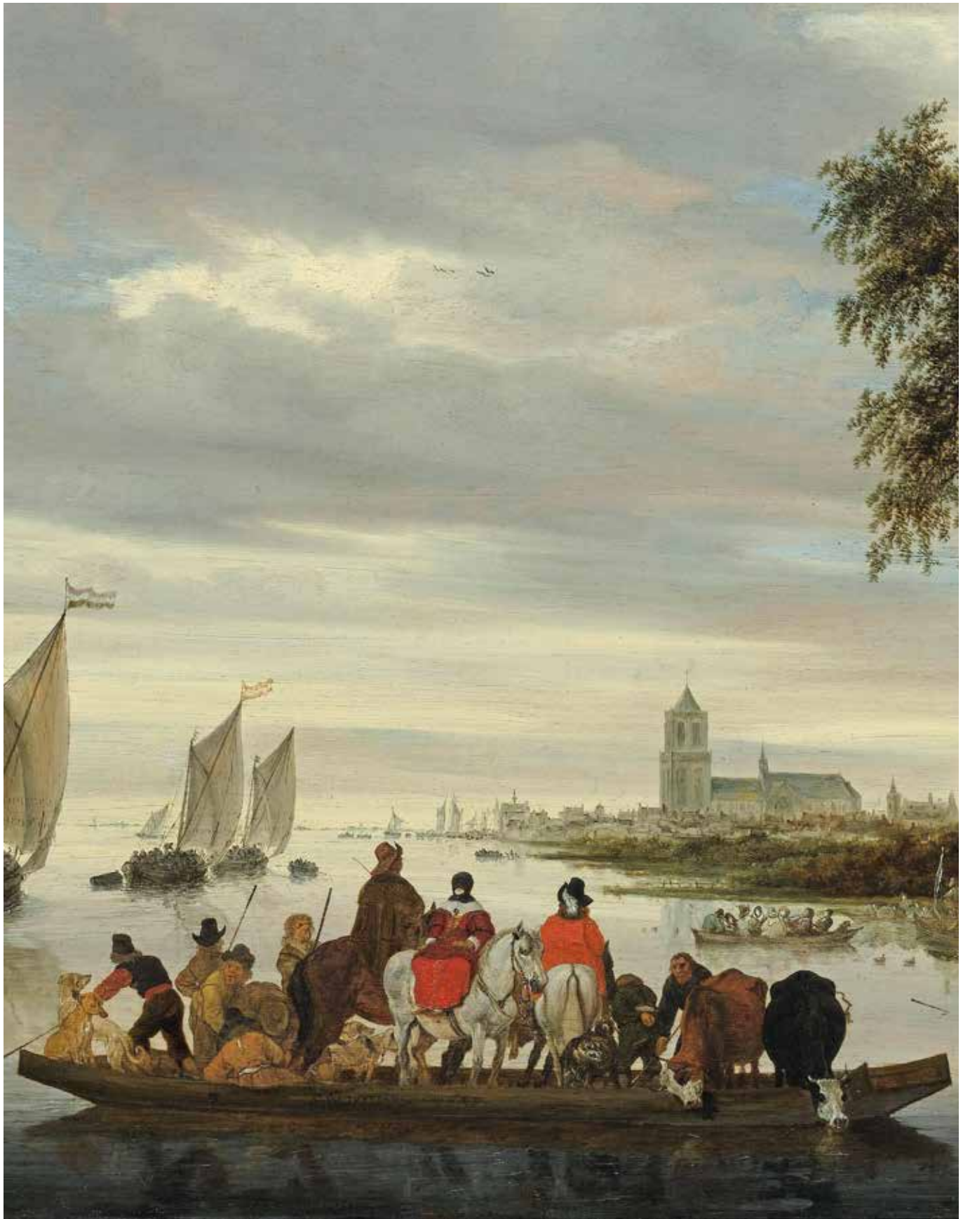
2 Salomon van Ruysdael, Rivierlandschap met een veerboot (detail), 1649. Amsterdam, Rijksmuseum